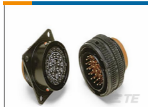
TE 产品编号ZPF000000000005394 910-6F 16-08 PN 01