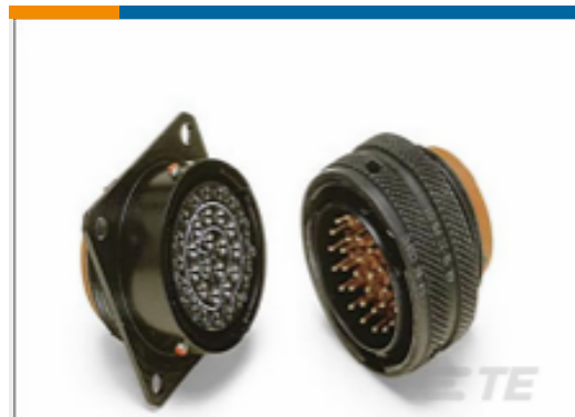
TE 产品编号ZPF000000000005395 910-6F 16-26 PN 01