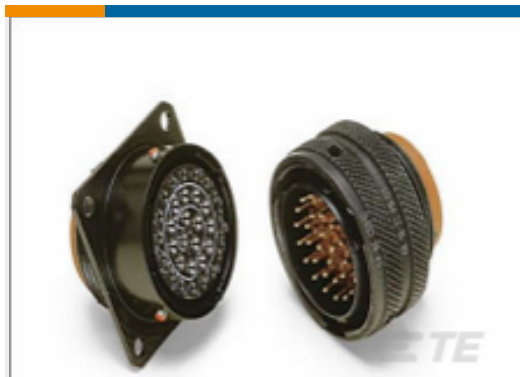
TE 产品编号ZPF000000000005267 910-0F 12-03 SN 01