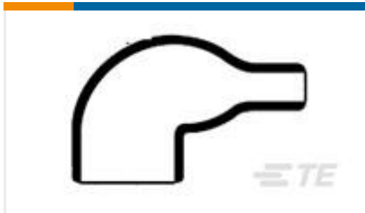
TE 产品编号806604-000 222A132-25-0