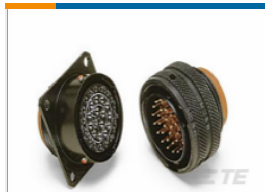
TE 产品编号ZPF000000000005387 910-6F 10-06 SN 01