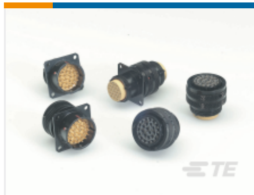
TE 产品编号ZPF00000000000019876 FDBA 57-12-3 SN-K 090 A499