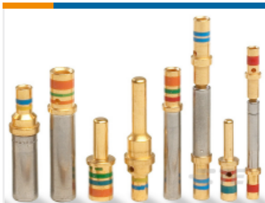
TE 产品编号ZPF0000000000003598 724-0003-20