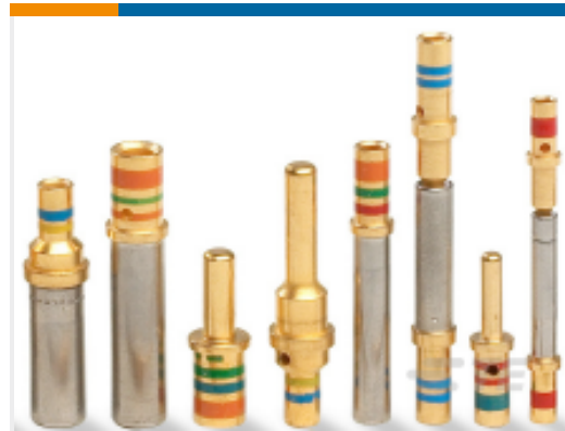
TE 产品编号ZPF000000000000569 020-0511-16