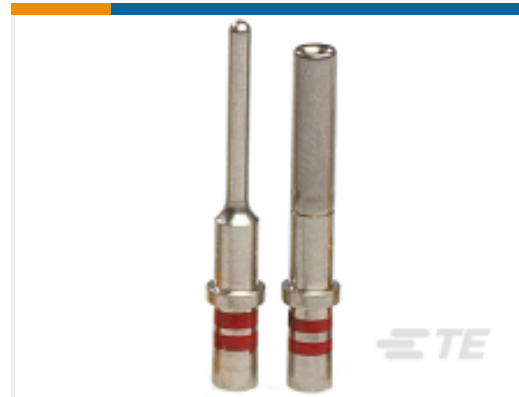
TE 产品编号ZPF000000000000435 006-1189-20