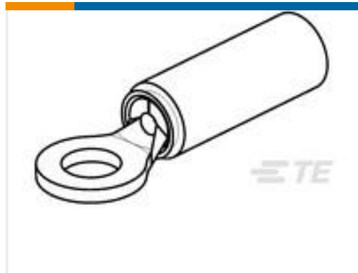
TE 产品编号1577626-1 TERMINAL RT PIDG PEEK STRATO 20 AWG