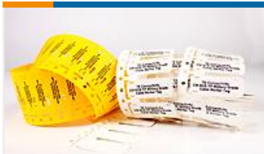
TE 产品编号768838-000 CM-SCE-TP-1/4-4H-9