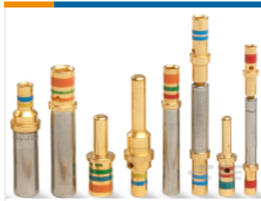
TE 产品编号ZPF0000000000001930 182-0118-20