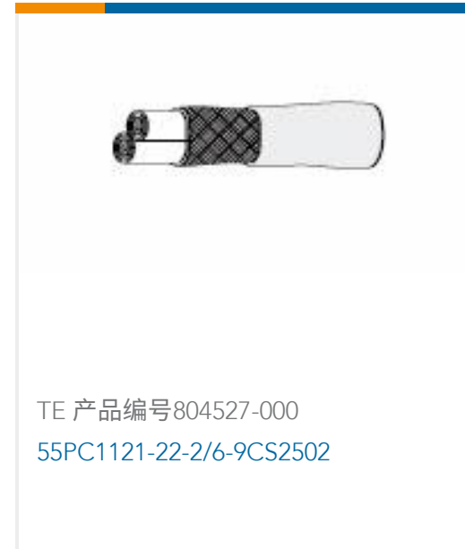
TE 产品编号804527-000 55PC1121-22-2/6-9CS2502