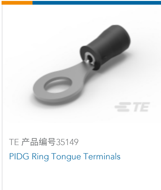
TE 产品编号35149 PIDG Ring Tongue Terminals