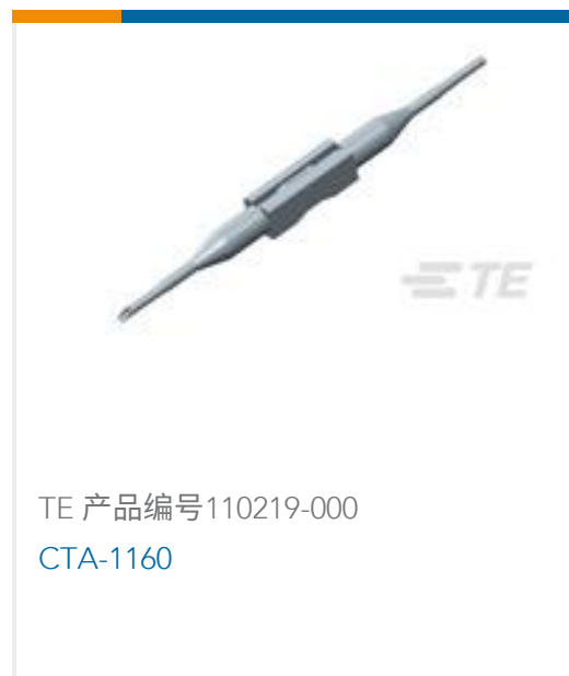
TE 产品编号110219-000 CTA-1160