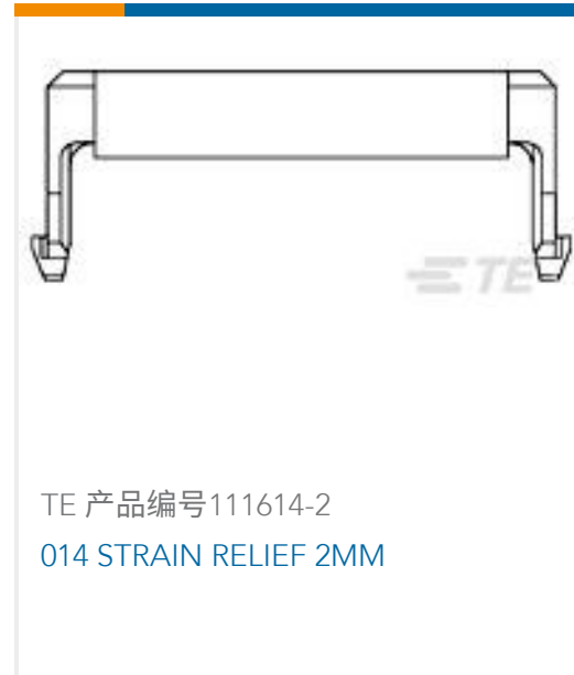
TE 产品编号111614-2 014 STRAIN RELIEF 2MM