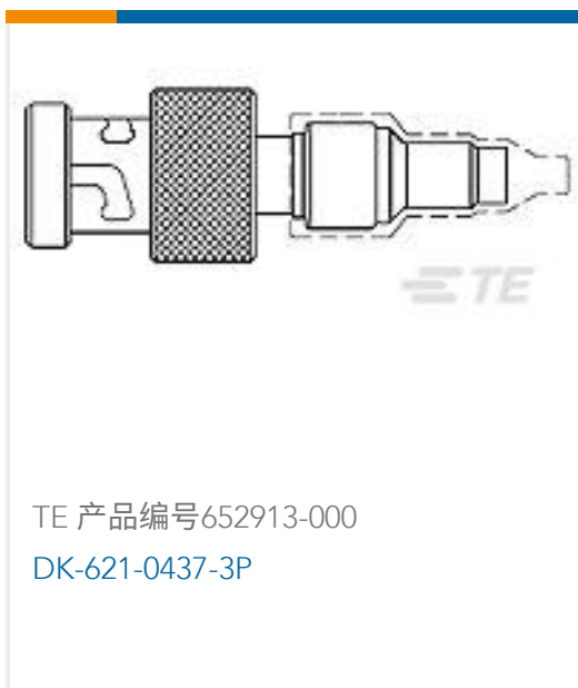
TE 产品编号652913-000 DK-621-0437-3P