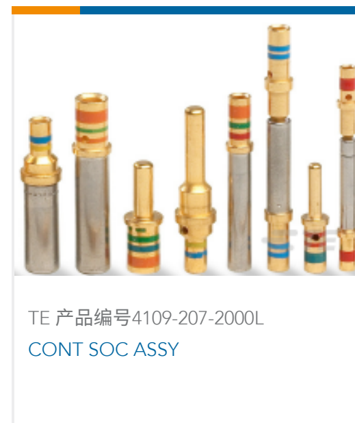
TE 产品编号4109-207-2000L CONT SOC ASSY