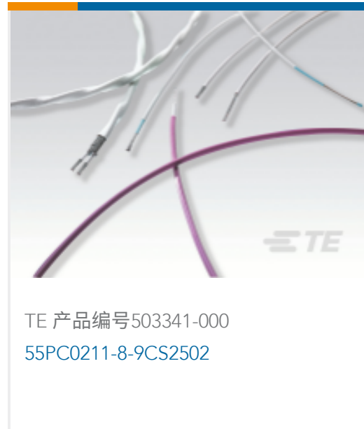
TE 产品编号503341-000 55PC0211-8-9CS2502