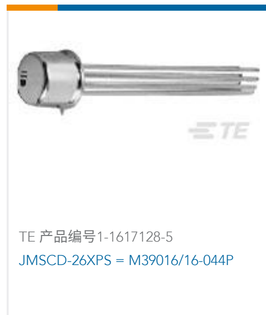
TE 产品编号1-1617128-5 JM3CD-26XPS = M39016/16-044P