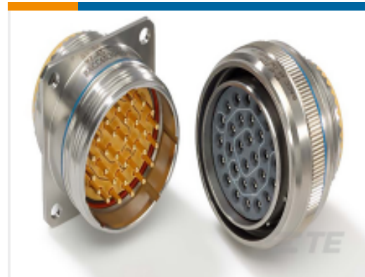
TE 产品编号ZPF0000000000033724 983-0SE 18-08 PN