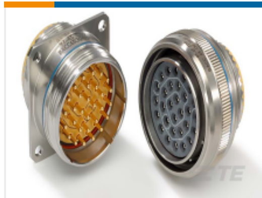
TE 产品编号ZPF000000000007565 983-0SE 14-07 PN