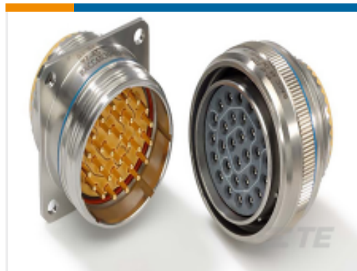
TE 产品编号ZPF000000000008709 983-6SE 08-03 S6