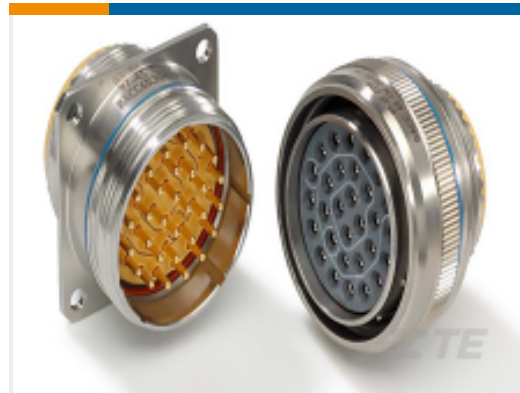
TE 产品编号ZPF000000000007574 983-0SE 14-07 SN