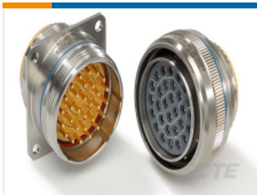
TE 产品编号ZPF0000000000033870 983-0SE 22-19 PN