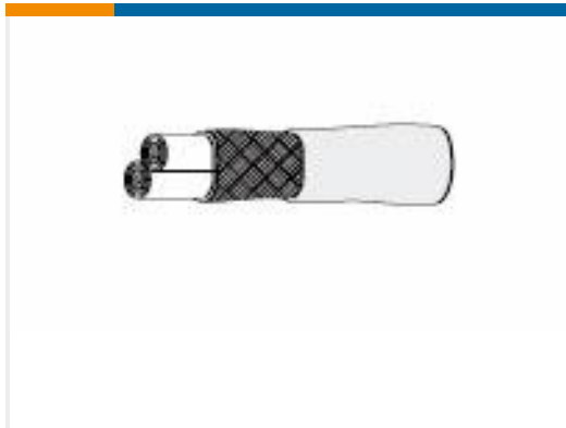
TE 产品编号751873-000 55A1842-20-MST4-9CS2275