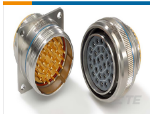
TE 产品编号ZPF000000000008834 983-6SE 14-07 PN