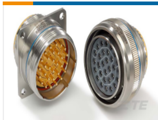
TE 产品编号ZPF000000000008790 983-6SE 12-03 SN