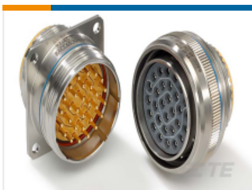
TE 产品编号ZPF000000000008870 983-6SE 16-10 PN