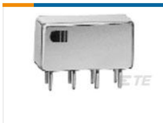
TE 产品编号2-1617037-2 HFW5A1230K00 = HFW5A RELAY