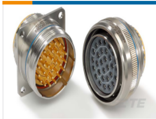
TE 产品编号ZPF000000000007686 983-0SE 20-41 PN-L