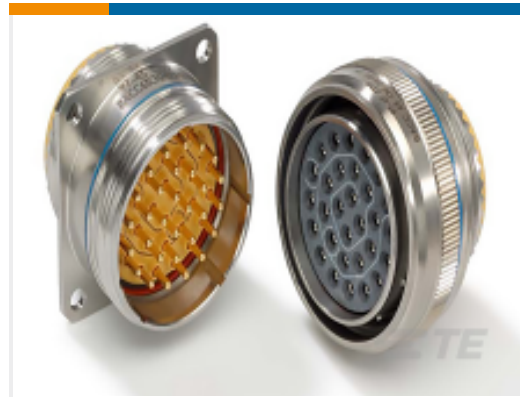
TE 产品编号ZPF000000000008742 983-6SE 10-05 PN