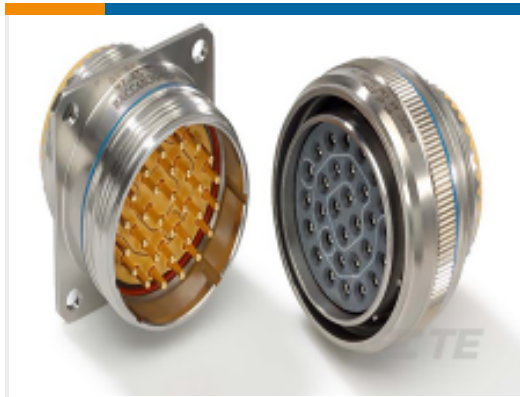
TE 产品编号ZPF000000000009000 983-6SE 22-55 PN