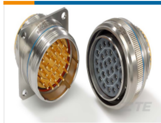
TE 产品编号ZPF000000000008846 983-6SE 14-07 SN