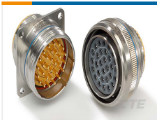
TE 产品编号ZPF000000000105618 983-6R 08-03 SN-A246