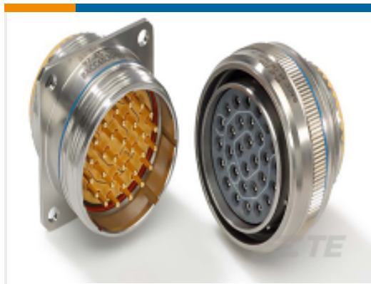
TE 产品编号ZPF000000000105746 983-6R 10-05 SN-A246