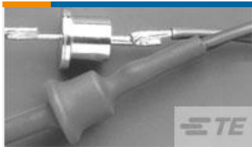
TE 产品编号5677714002 RNF-3000-6/2-4-SP