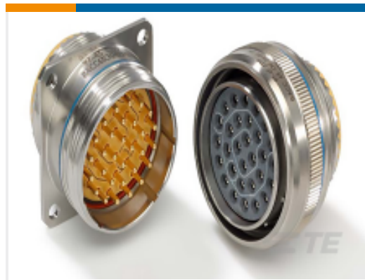
TE 产品编号ZPF000000000008584 983-6S 12-12 PN