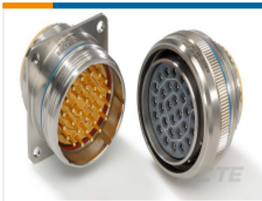
TE 产品编号ZPF000000000007358 983-0S 12-12 PN