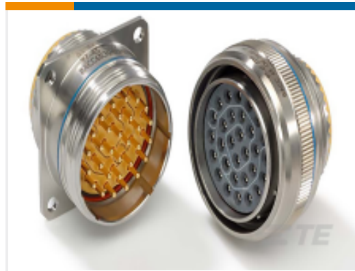
TE 产品编号ZPF000000000007308 983-0S 08-03 PN