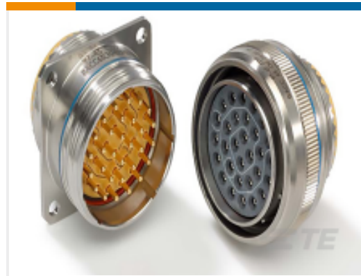
TE 产品编号ZPF00000000008886 983-6SE 16-24 PN