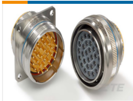
TE 产品编号ZPF00000000008839 983-6SE 14-07 S6 L