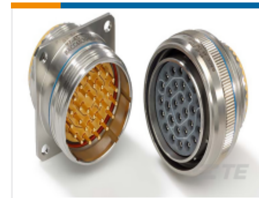
TE 产品编号ZPF000000000009140 983-7SE 14-15 PN