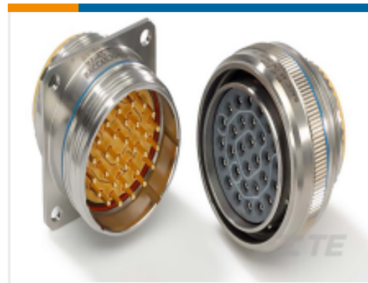
TE 产品编号ZPF000000000008894 983-6SE 16-24 S7