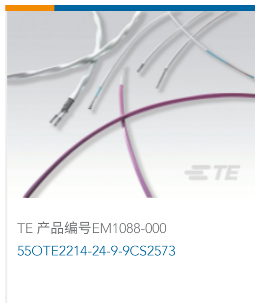
TE 产品编号EM1088-000 55OTE2214-24-9-9CS2573