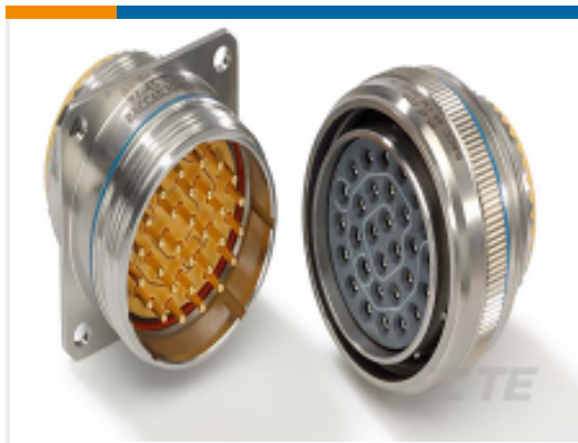
TE 产品编号ZPF000000000008891 983-6SE 16-24 S6