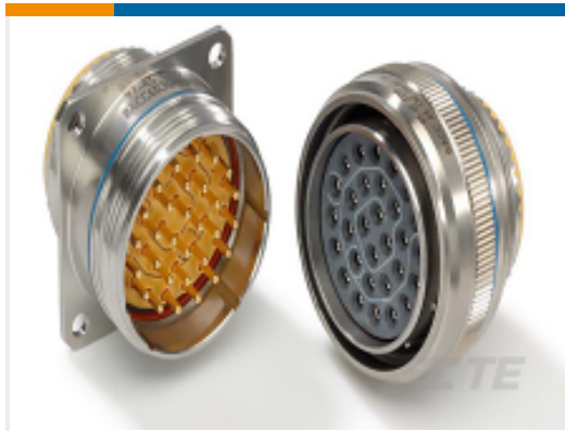
TE 产品编号ZPF000000000036902 983-6SE 10-06 S7