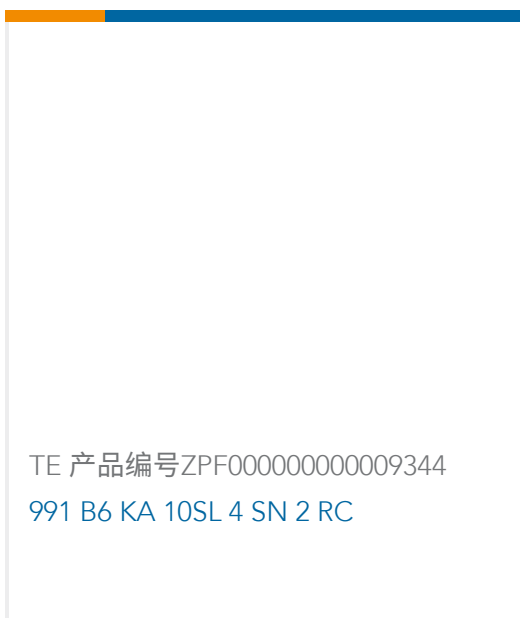
TE 产品编号ZPF000000000009344 991 B6 KA 10SL 4 SN 2 RC