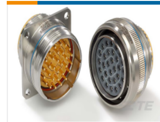
TE 产品编号ZPF000000000008858 983-6SE 14-15 PN