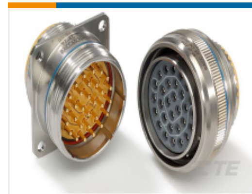
TE 产品编号ZPF000000000039510 983-7SE 14-07 PN