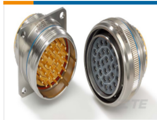
TE 产品编号ZPF000000000007631 983-0SE 18-14 SN