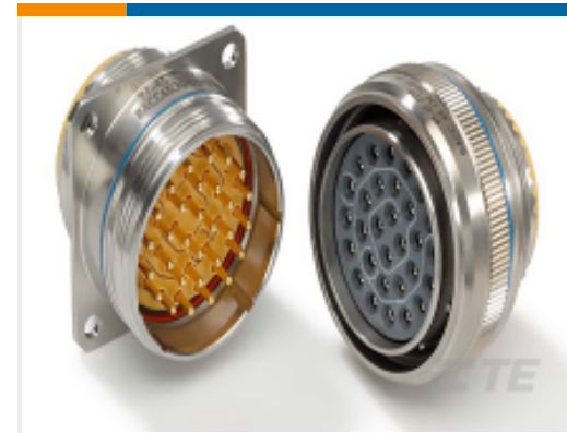
TE 产品编号ZPF000000000008834 983-6SE 14-07 PN