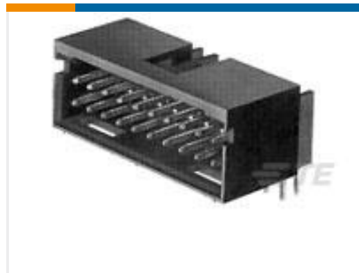
TE 产品编号6-103167-2 30 MODII HDR DRRA SHRD LF