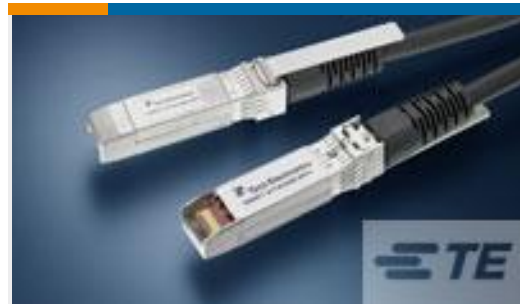
TE 产品编号2127931-4 C/A, SFP+, GENERIC, 3.0M