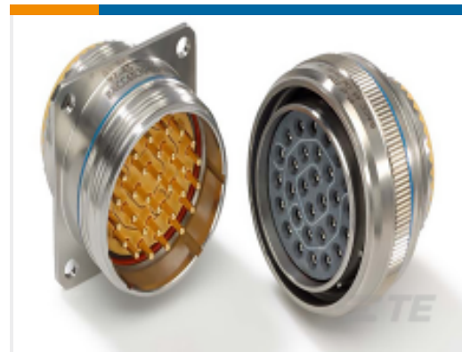
TE 产品编号ZPF000000000007578 983-0SE 14-12 SN-L