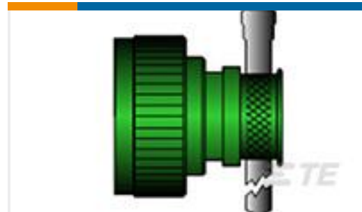
TE 产品编号CW4472-000 R85049/82-08N03