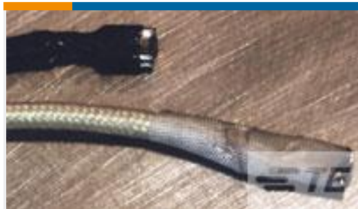
TE 产品编号9965874002 RT555-1-0-SP