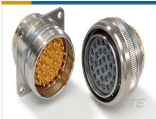
TE 产品编号ZPF000000000033663 983-0SE 14-12 PN