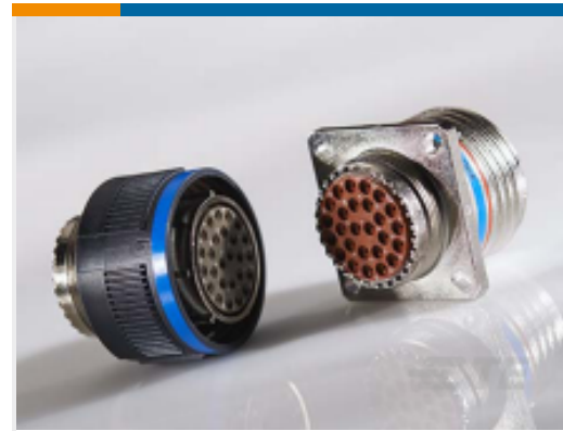
TE 产品编号ZPF00000000016640 DTS 24 S 17-26 PB