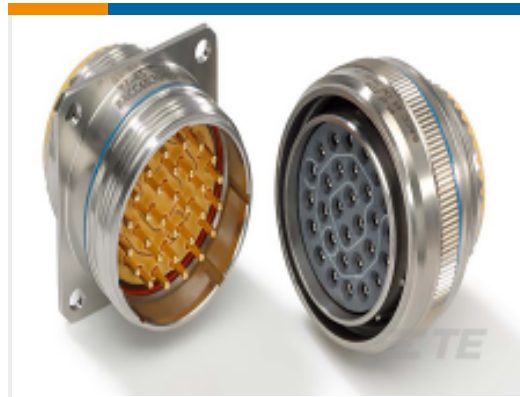
TE 产品编号ZPF000000000147262 983-6SE 18-14 SN-A6160