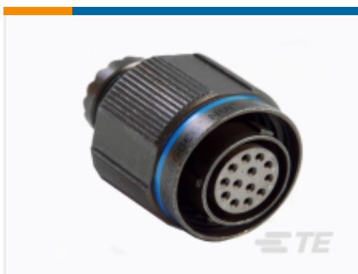
TE 产品编号ZPF000000000095012 DTS 26 S 17-08 SB