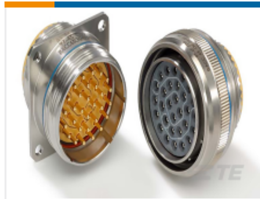
TE 产品编号ZPF00000000037102 983-6SE 20-25 SN