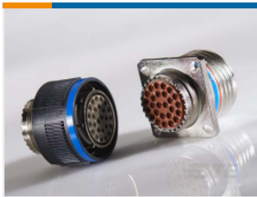
TE 产品编号ZPF00000000017213 DTS 26 S 25-04 SC