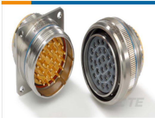
TE 产品编号ZPF000000000008886 983-6SE 16-24 PN