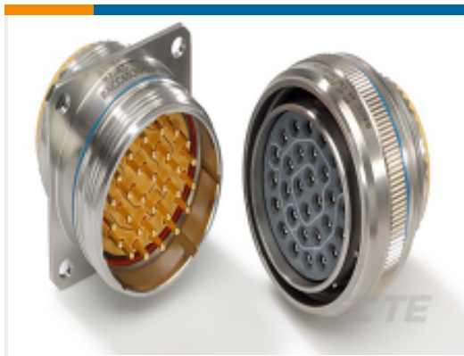
TE 产品编号 ZPF000000000008602 983-6S 14-07 PN