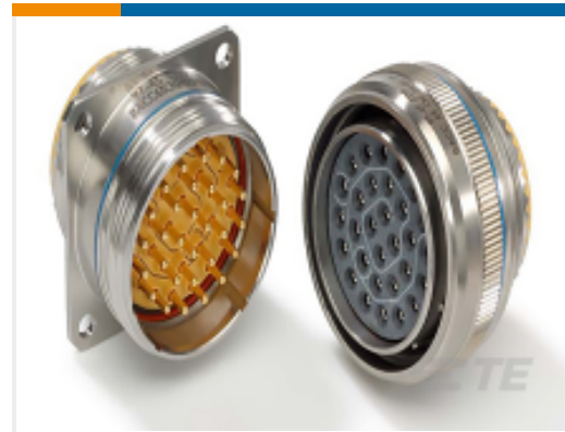
TE 产品编号 ZPF00000000007579 983-0SE 14-15 PN