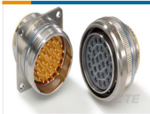
TE 产品编号 ZPF000000000122663 983-0S 18-31 P6-A1208