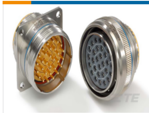
TE 产品编号 ZPF00000000106688 983-0S 18-31 PN-A1208