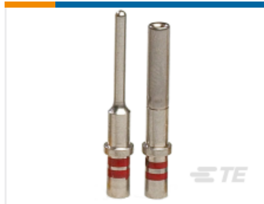
TE 产品编号ZPF000000000001261 097-0267-16 A1267