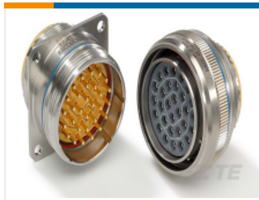
TE 产品编号ZPF0000000000007174 983-ORS 08-98 PN