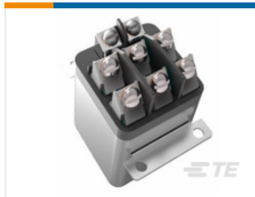
TE 产品编号1617807-5 FC-335-SY8= RELAY, 3PST