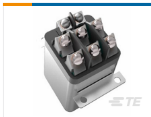
TE 产品编号1617807-5 FC-335-SY8= RELAY, 3PST