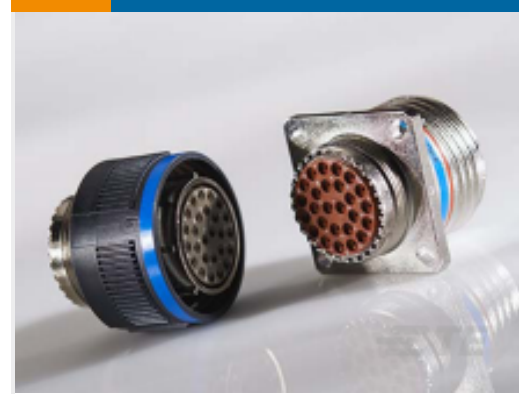
TE 产品编号ZPF00000000017203 DTS 26 S 21-41 SN