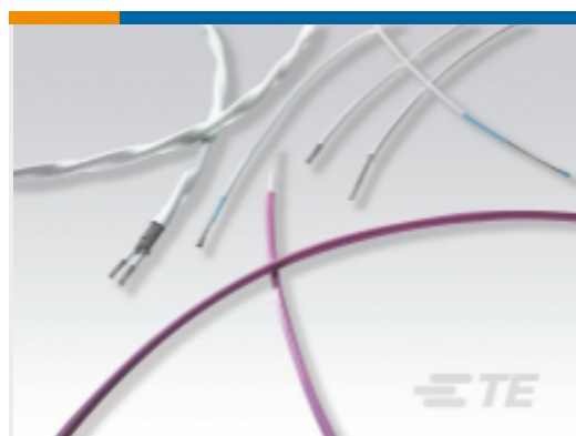
TE 产品编号CX7792-000 WXA-0202-0-9CS3264