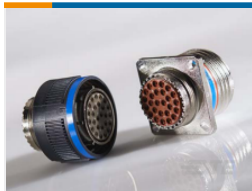
TE 产品编号ZPF000000000095149 DTS 26 S 25-61 PN