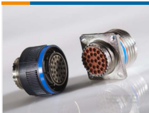
TE 产品编号ZPF000000000095119 DTS 26 S 23-53 SD