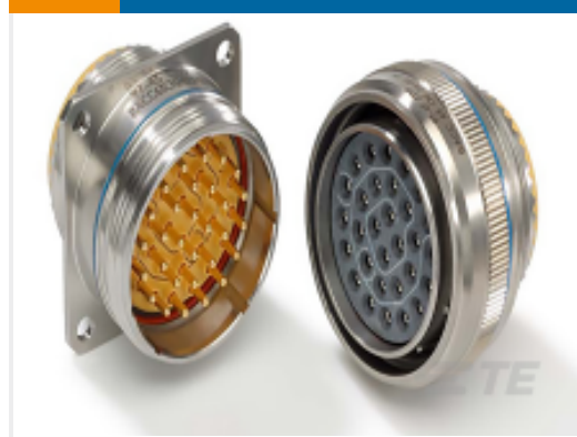
TE 产品编号ZPF000000000163951 983-15 S 2-10-12 PN