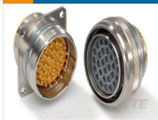
TE 产品编号ZPF00000000008918 983-6SE 18-14 S6