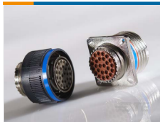
TE 产品编号ZPF000000000095151 DTS 26 S 25-61 SB