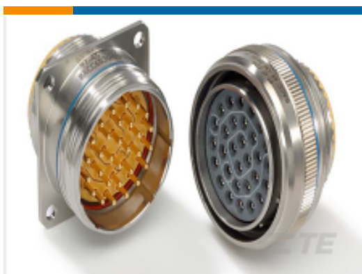
TE 产品编号ZPF0000000000008705 983-6SE 08-03 PN