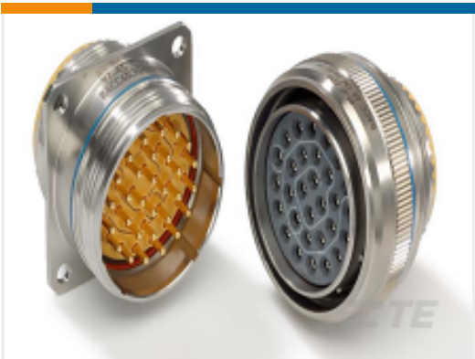
TE 产品编号ZPF0000000000036863 983-6SE 08-03 P6