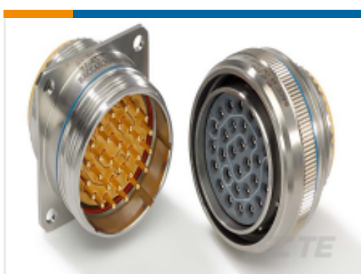
TE 产品编号ZPF00000000000205454 983-6SE 22-39 SN