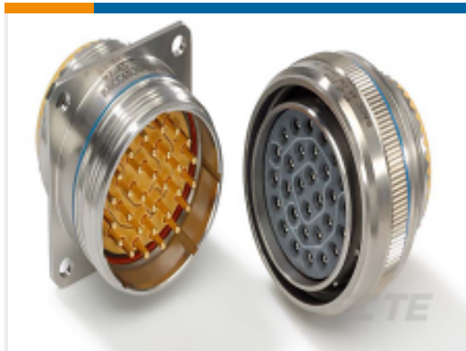
TE 产品编号ZPF000000000007504 983-0SE 10-06 PN