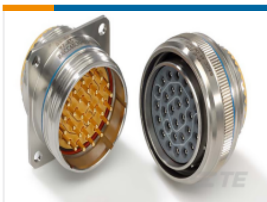
TE 产品编号ZPF0000000000122633 983-6SE 10-05 SN-A1208