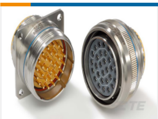
TE 产品编号ZPF0000000000122653 983-6SE 20-39 PN-A1208