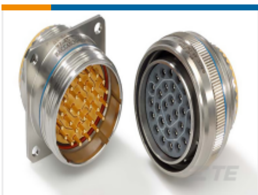
TE 产品编号ZPF0000000000008758 983-6SE 10-06 PN