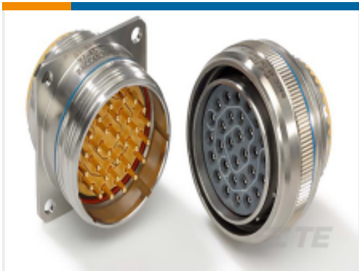
TE 产品编号ZPF000000000007462 983-0SE 08-03 P9