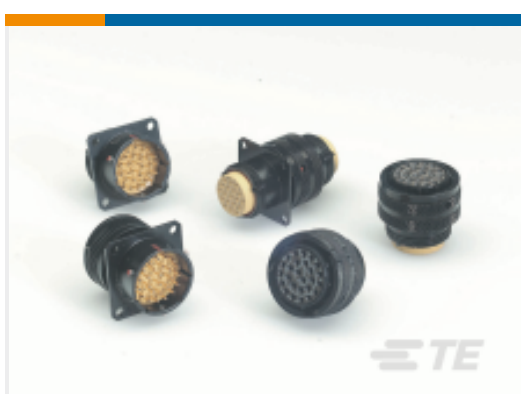
TE 产品编号ZPF0000000000019264 FDPA 56-14-15 SN-K 059