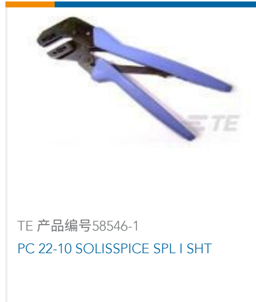
TE 产品编号58546-1 PC 22-10 SOLISSPICE SPL I SHT