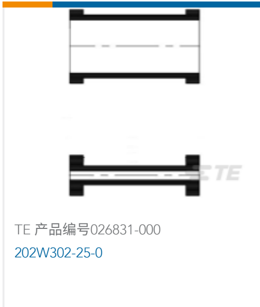
TE 产品编号026831-000 202W302-25-0