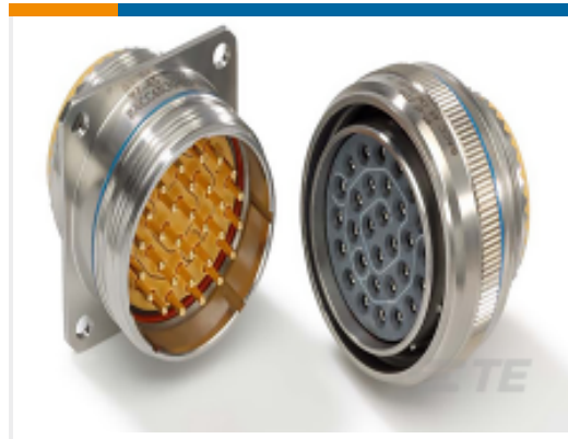
TE 产品编号ZPF000000000008899 983-6SE 16-24 SN