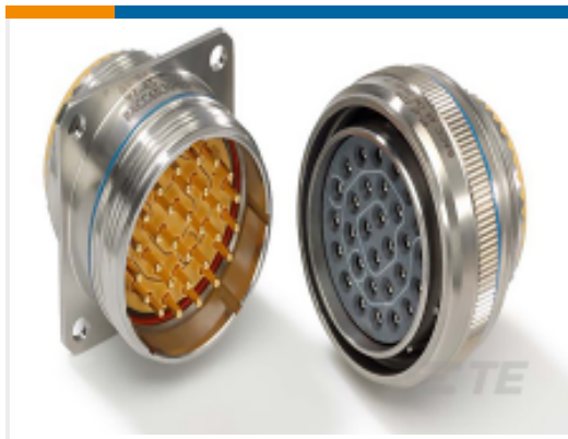
TE 产品编号ZPF000000000007579 983-0SE 14-15 PN