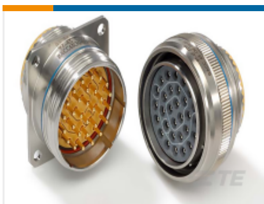
TE 产品编号ZPF0000000000037034 983-6SE 18-08 S9