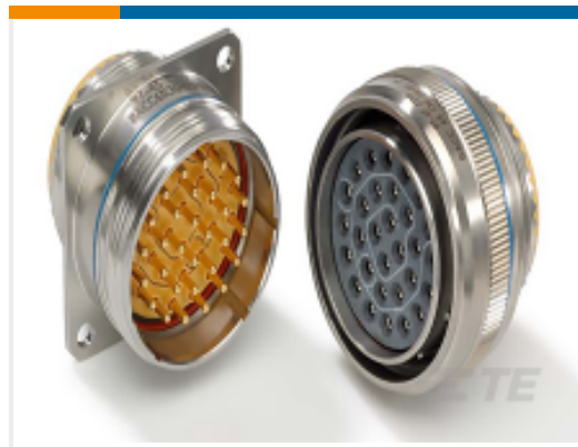
TE 产品编号ZPF000000000008602 983-6S 14-07 PN