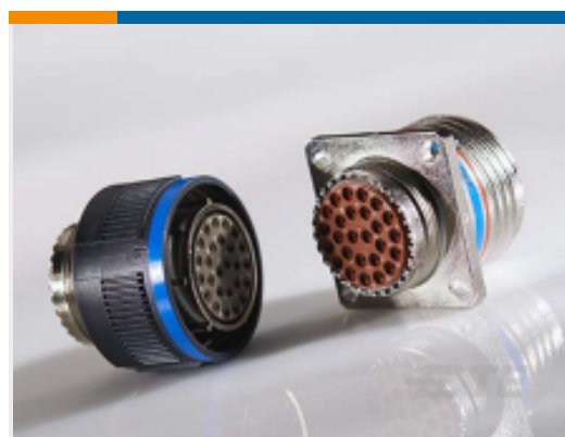
TE 产品编号ZPF0000000000094669 DTS 26 K 15-97 PA