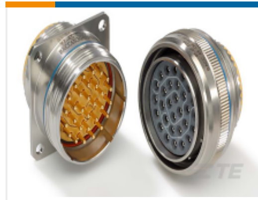
TE 产品编号ZPF000000000106688 983-0S 18-31 PN-A1208