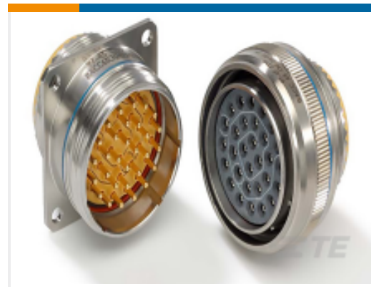
TE 产品编号ZPF0000000000037023 983-6SE 18-08 P8