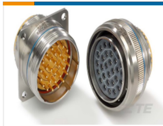
TE 产品编号ZPF0000000000037019 983-6SE 18-08 P6