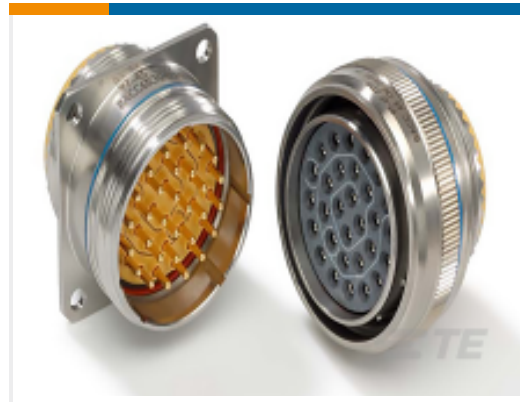
TE 产品编号ZPF000000000122663 983-0S 18-31 P6-A1208