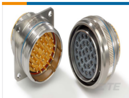
TE 产品编号ZPF000000000008522 983-6S 08-03 S7 L