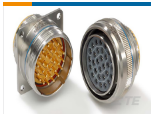
TE 产品编号ZPF000000000008629 983-6S 16-24 S6 L