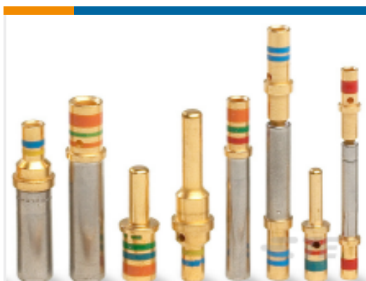
TE 产品编号 ZPF0000000000000345 006-0912-20 A