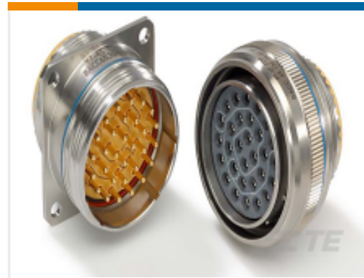
TE 产品编号ZPF000000000008600 983-6S 14-07 P7