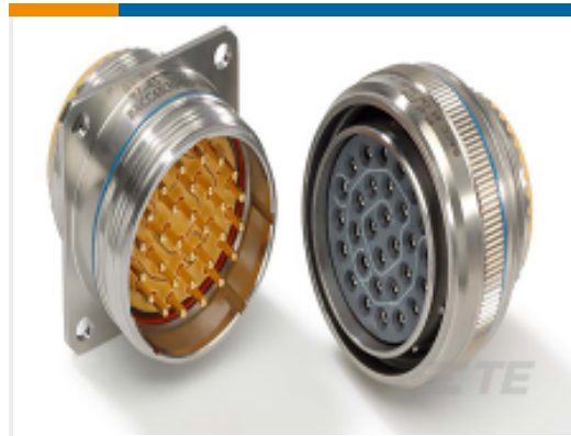
TE 产品编号ZPF000000000008538 983-6S 10-05 S6