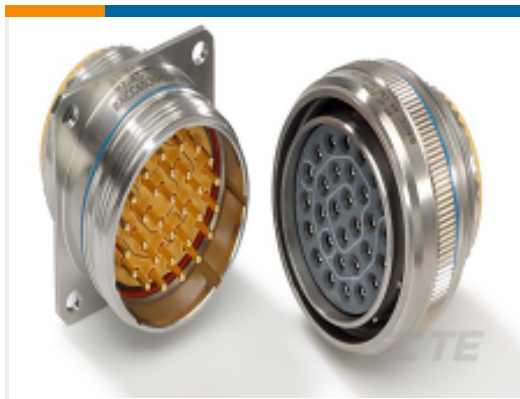
TE 产品编号ZPF000000000008606 983-6S 14-07 SN