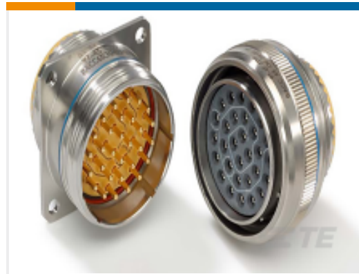
TE 产品编号ZPF000000000008549 983-6S 10-05 SN