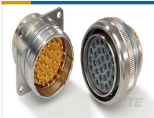
TE 产品编号ZPF000000000008526 983-6S 08-03 SN