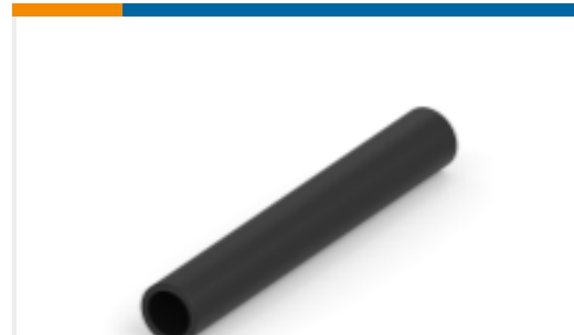
TE 产品编号CX1369-000 BSTS/BSTS-FR 热缩管