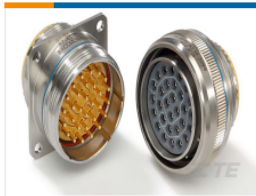
TE 产品编号ZPF000000000008643 983-6S 18-14 S6