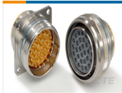
TE 产品编号ZPF000000000008130 983-6K 16-24 S9 L