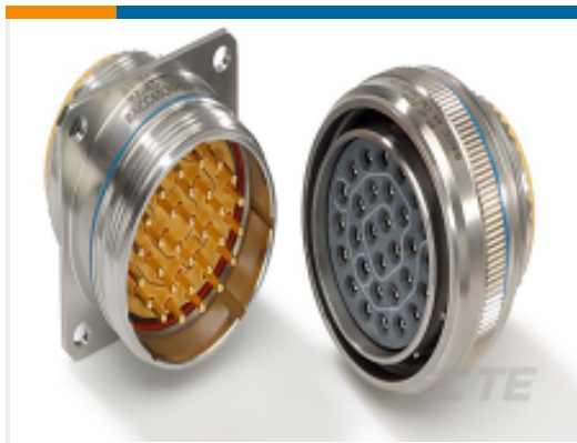
TE 产品编号ZPF000000000008622 983-6S 16-10 SN