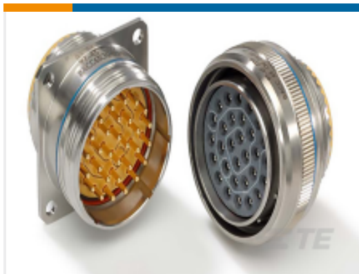
TE 产品编号ZPF000000000008703 983-6SE 08-03 P8