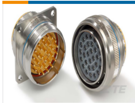
TE 产品编号ZPF000000000008119 983-6K 14-15 SN-L