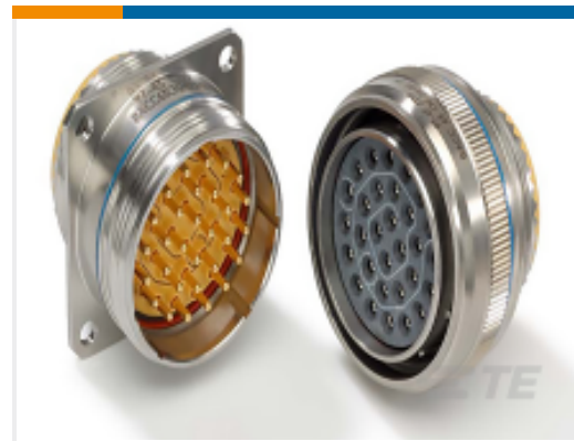
TE 产品编号ZPF000000000008665 983-6S 20-39 P7