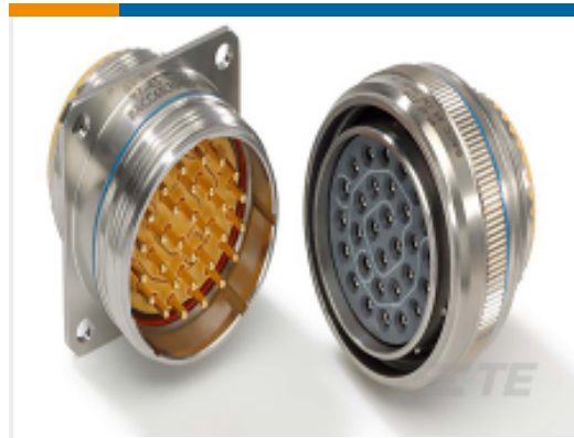
TE 产品编号ZPF000000000008084 983-6K 10-06 SN-L