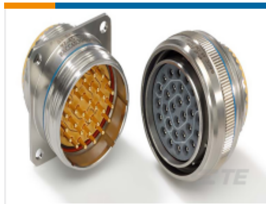
TE 产品编号ZPF000000000008625 983-6S 16-24 PN