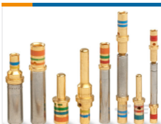
TE 产品编号 ZPF0000000000000335 006-0912-12 A