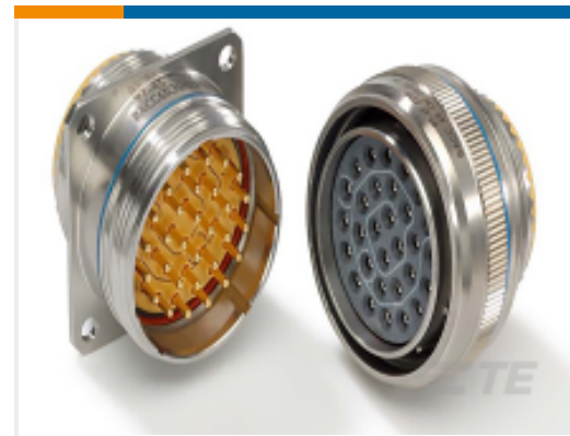
TE 产品编号ZPF000000000037028 983-6SE 18-08 S6