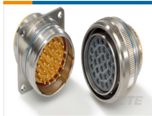
TE 产品编号ZPF000000000122658 983-0S 12-12 PN-A1208