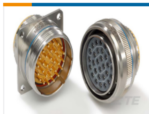
TE 产品编号ZPF000000000114138 983-6SE 24-30 PN-A1208