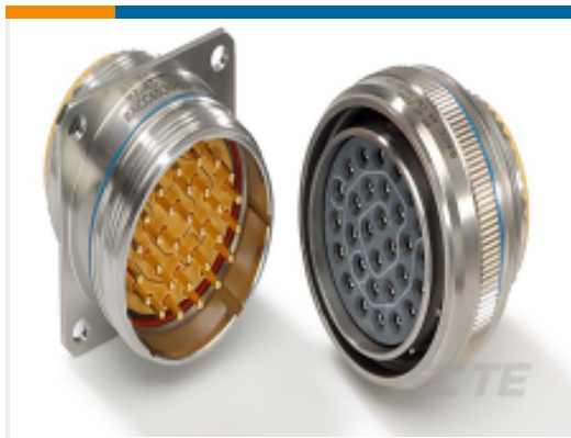
TE 产品编号ZPF000000000037019 983-6SE 18-08 P6