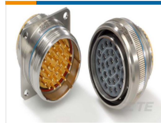
TE 产品编号ZPF000000000106688 983-0S 18-31 PN-A1208