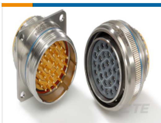
TE 产品编号ZPF000000000114632 983-6SE 22-39 PN