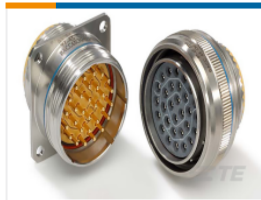
TE 产品编号ZPF000000000037021 983-6SE 18-08 P7