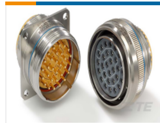
TE 产品编号ZPF000000000037111 983-6SE 20-28 PN