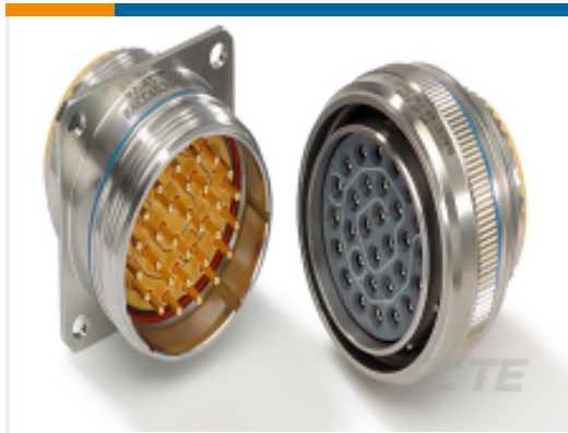
TE 产品编号ZPF000000000037027 983-6SE 18-08 PN