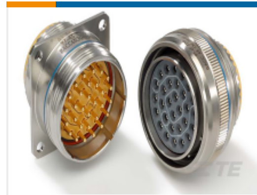
TE 产品编号ZPF000000000122663 983-0S 18-31 P6-A1208