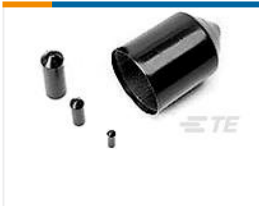
TE 产品编号843032-000 101A041-3-0