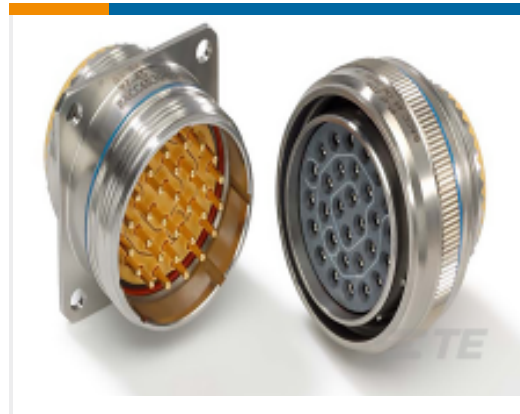
TE 产品编号ZPF000000000008008 983-1Y 10-05 PN