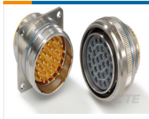
TE 产品编号ZPF000000000008026 983-1YE 08-03 P8