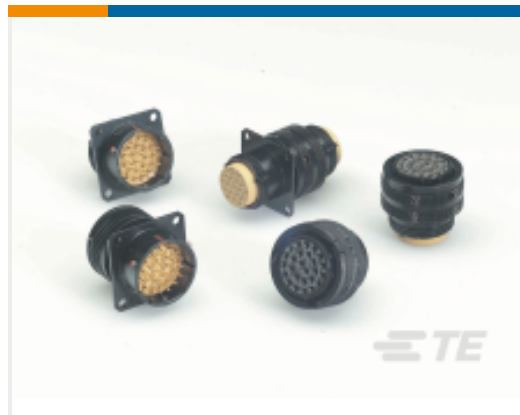
TE 产品编号ZPF0000000000018816 FD8A 53H 8-3A-PX-K