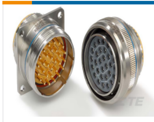
TE 产品编号ZPF000000000007999 983-1Y 08-03 PN