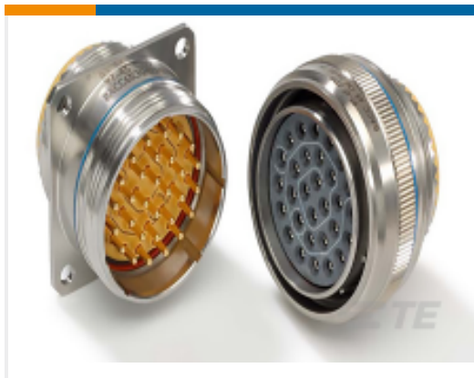
TE 产品编号ZPF000000000008517 983-6S 08-03 S6