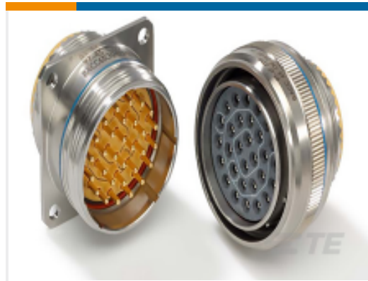
TE 产品编号ZPF000000000007823 983-0Y 14-15 PN