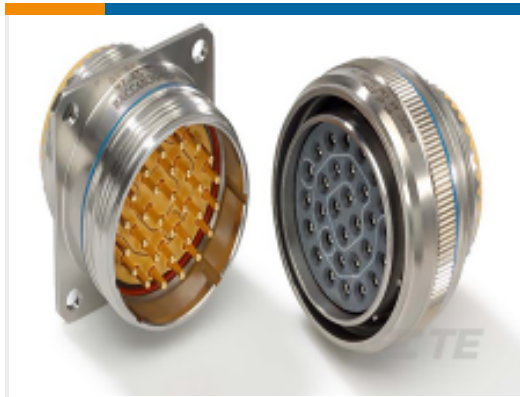
TE 产品编号ZPF000000000007374 983-0S 14-15 PN