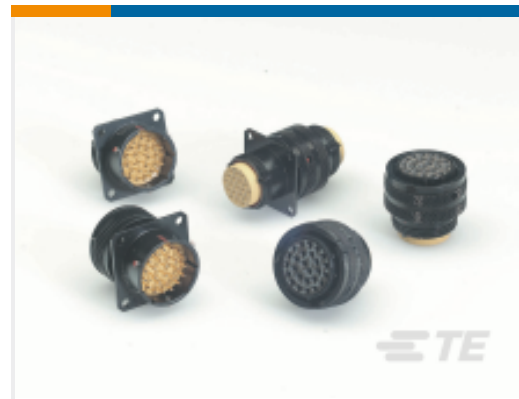
TE 产品编号ZPF000000000018816 FD8A 53H 8-3A-PX-K