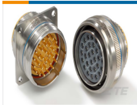
TE 产品编号ZPF000000000008026 983-1YE 08-03 P8