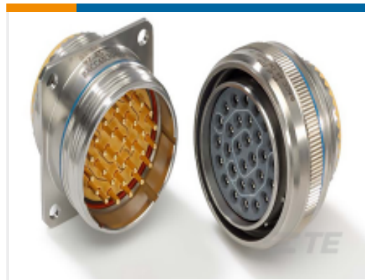
TE 产品编号ZPF000000000008560 983-6S 10-06 S6