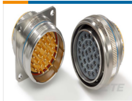
TE 产品编号ZPF000000000008083 983-6K 10-06 SN