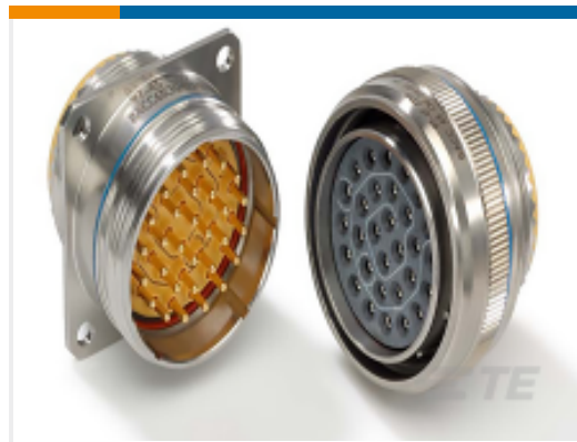
TE 产品编号ZPF000000000008526 983-6S 08-03 SN