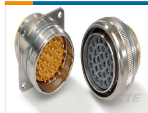
TE 产品编号ZPF000000000008874 983-6SE 16-10 S6