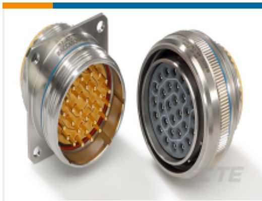
TE 产品编号ZPF00000000007381 983-0S 16-10 PN