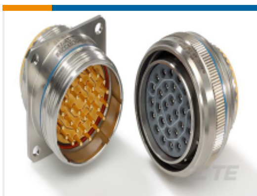
TE 产品编号ZPF000000000036910 983-6SE 12-03 S6