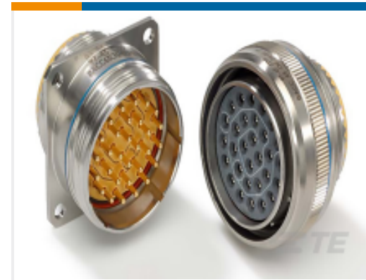
TE 产品编号ZPF000000000033241 983-0S 14-07 S7