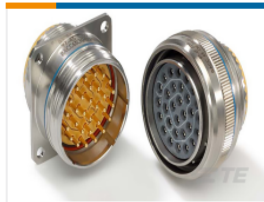
TE 产品编号ZPF00000000007427 983-0S 20-41 P6