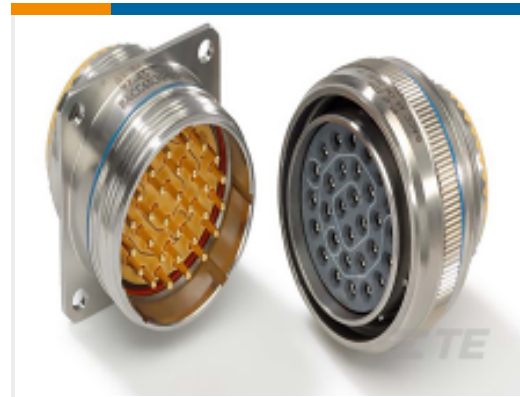
TE 产品编号ZPF000000000033239 983-0S 14-07 S6