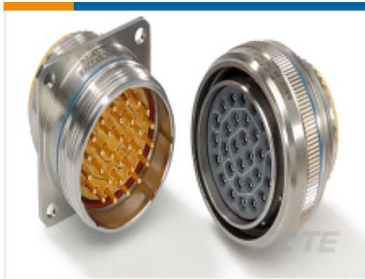
TE 产品编号ZPF000000000007383 983-0S 16-10 SN