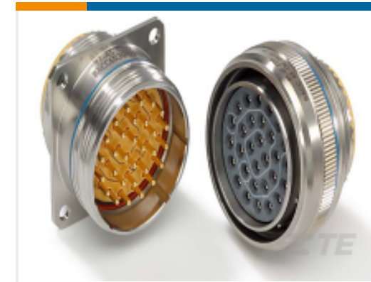
TE 产品编号ZPF00000000007372 983-0S 14-07 SN