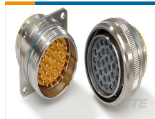
TE 产品编号ZPF1000000000033774 983-0SE 20-16 S6 L