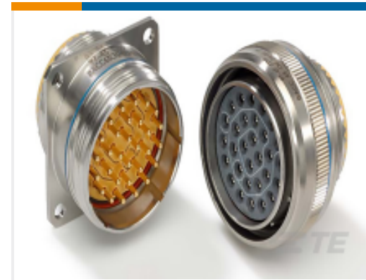
TE 产品编号ZPF000000000008848 983-6SE 14-07 SN-L