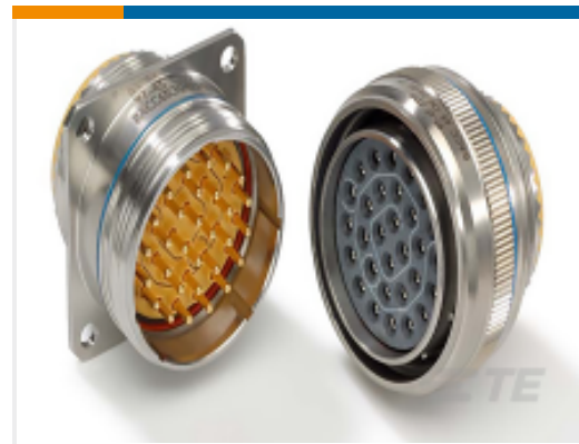
TE 产品编号ZPF100000000007509 983-0SE 10-06 S7 L