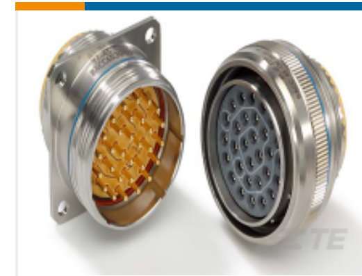
TE 产品编号ZPF000000000009071 983-6W 12-12 SN-L