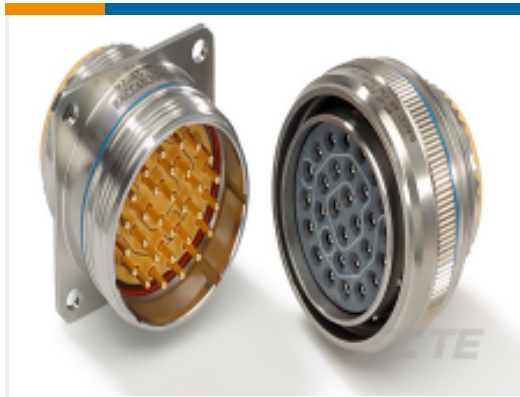
TE 产品编号ZPF100000000009141 983-7SE 14-15 PN-L