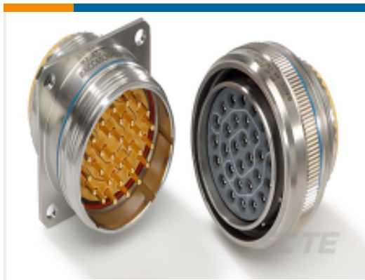
TE 产品编号ZPF000000000009086 983-6W 20-28 SN-L