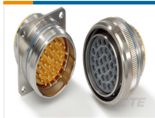
TE 产品编号ZPF000000000008068 983-6K 08-98 SN-L