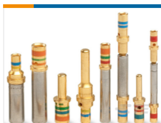
TE 产品编号 ZPF0000000000001246 097-0205-20