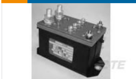
TE 产品编号1616058-6 A703CD (FAA/PMA)=RELAY