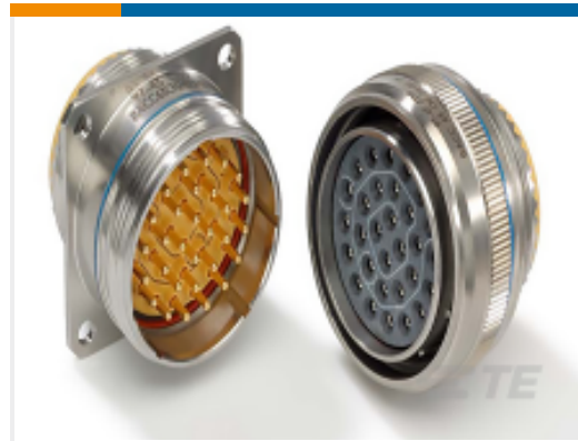
TE 产品编号ZPF000000000008632 983-6S 16-24 SN