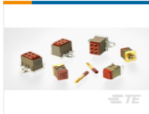
TE 产品编号CTJ720E01B-7067 MODULE ASSY