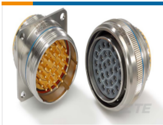
TE 产品编号ZPF000000000008147 983-6K 18-31 SN