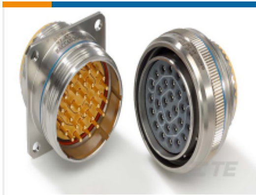
TE 产品编号ZPF000000000008591 983-6S 12-12 SN