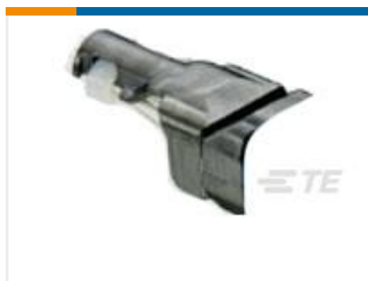
TE 产品编号D369-STB-9 369 9 WAY BACKSHELL STRAIGHT TIE WRAP