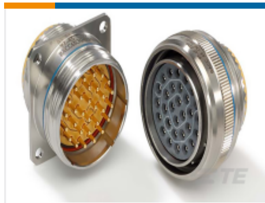
TE 产品编号ZPF000000000008628 983-6S 16-24 S6