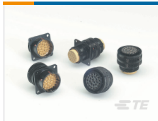
TE 产品编号ZPF000000000019680 FDBA 56-22-55 SN-K-A6032