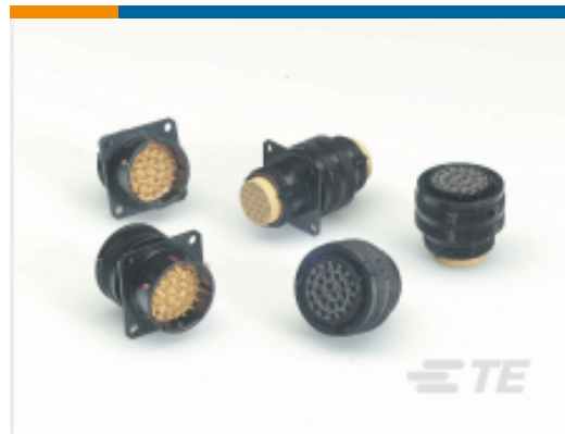
TE 产品编号ZPF000000000018650 FDBA 50-8-33 PN-K-A6030