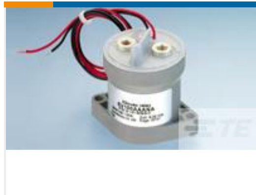
TE 产品编号5-1618398-0 EV100AAANA=CONTACTOR, SPST- NO 9-36Vdc