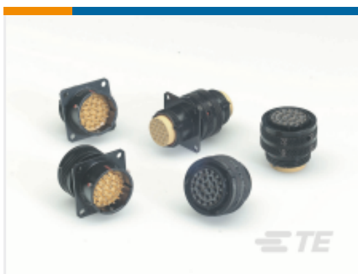
TE 产品编号ZPF000000000019686 FDBA 56-22-55 SW-K-A6032