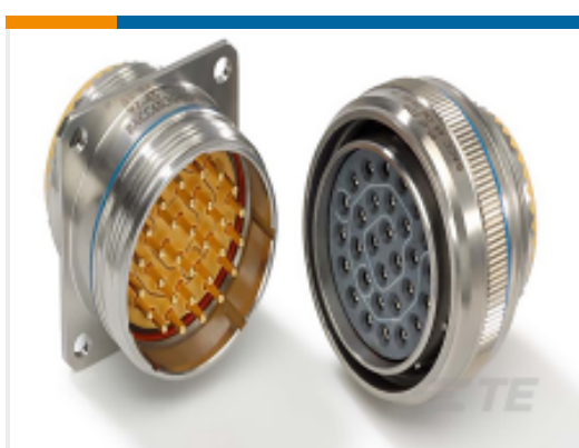
TE 产品编号 ZPF000000000007836 983-0Y 22-55 P6