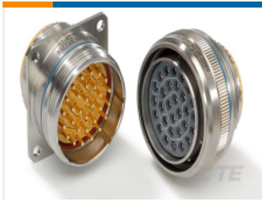
TE 产品编号ZPF000000000007332 983-0S 10-06 P6