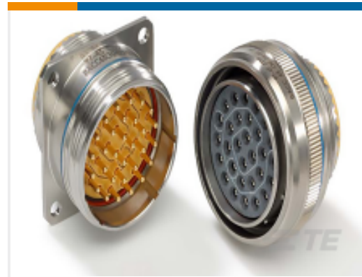
TE 产品编号ZPF000000000008095 983-6K 12-12 S6