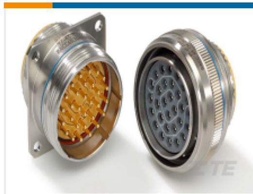
TE 产品编号ZPF000000000008158 983-6K 20-41 SN