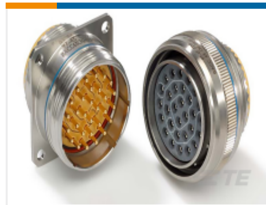
TE 产品编号ZPF000000000008176 983-6K 24-61 SN