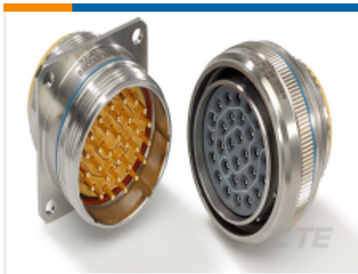
TE 产品编号ZPF000000000008099 983-6K 12-12 SN