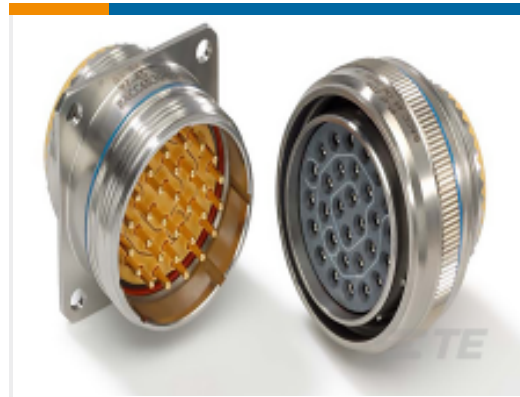
TE 产品编号ZPF000000000008076 983-6K 10-05 SN