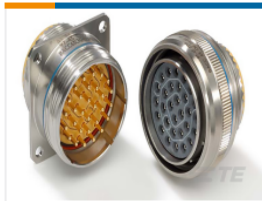
TE 产品编号ZPF000000000008173 983-6K 24-61 S6