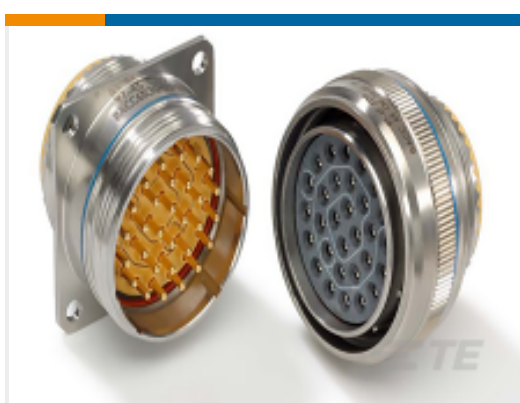
TE 产品编号 ZPF000000000007833 983-0Y 20-41 P7