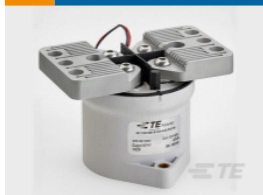
TE 产品编号6-1618413-7 K1K06H012EAFA=CONTACTOR SPST- NO W/AUX