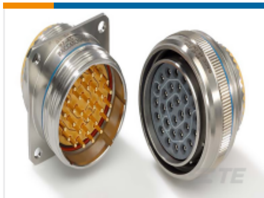
TE 产品编号ZPF000000000008090 983-6K 12-03 SN-L