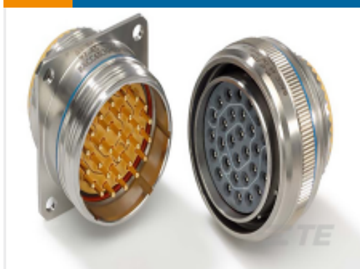
TE 产品编号ZPF000000000007595 983-0SE 16-10 PN-L