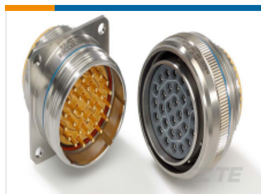
TE 产品编号ZPF000000000008125 983-6K 16-24 S6 L