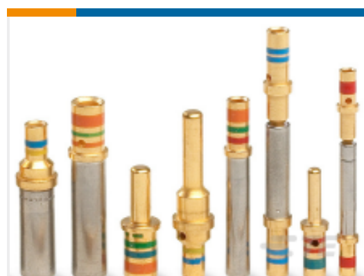
TE 产品编号 ZPF0000000000000339 006-0912-16 A