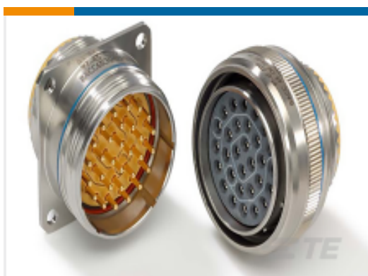
TE 产品编号ZPF100000000008187 983-6KE 08-03 S6 L