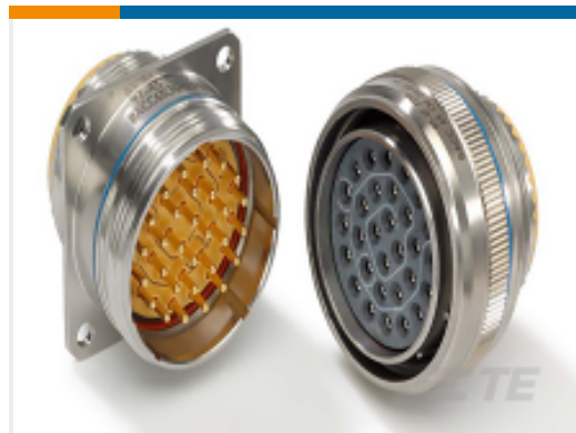
TE 产品编号ZPF000000000008110 983-6K 14-07 PN-L