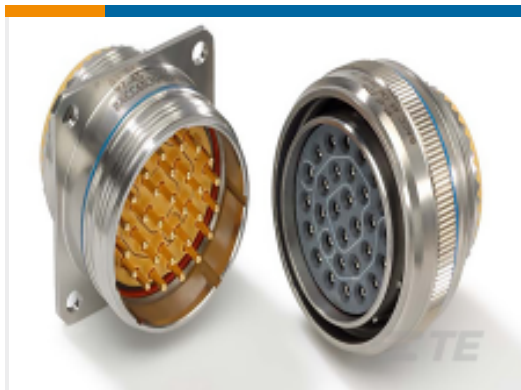
TE 产品编号ZPF000000000008062 983-6K 08-03 S6 L