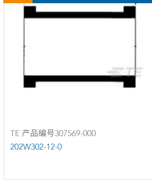
TE 产品编号307569-000 202W302-12-0