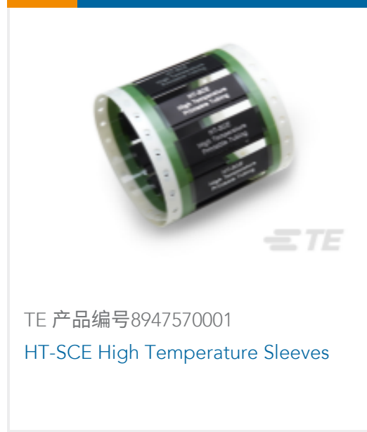
TE 产品编号8947570001 HT-SCE High Temperature Sleeves