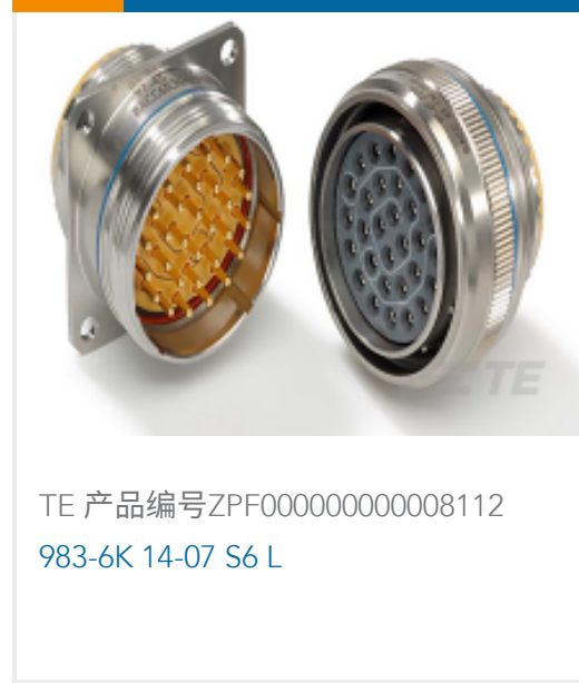
TE 产品编号ZPF000000000008112 983-6K 14-07 S6 L