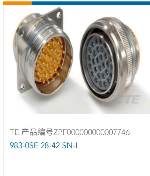
TE 产品编号ZPF000000000007746 983-0SE 28-42 SN-L