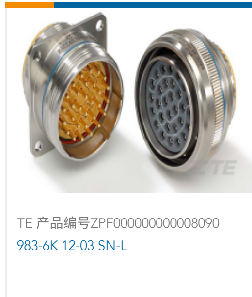
TE 产品编号ZPF000000000008090 983-6K 12-03 SN-L