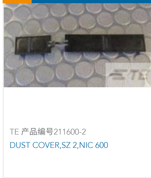
TE 产品编号211600-2 DUST COVER, SZ 2, NIC 600