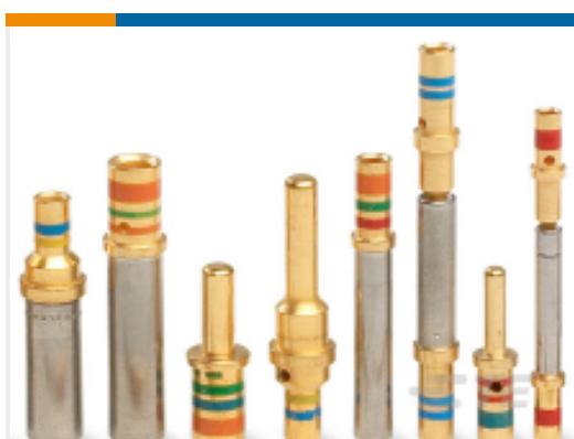
TE 产品编号 ZPF000000000000345 006-0912-20 A