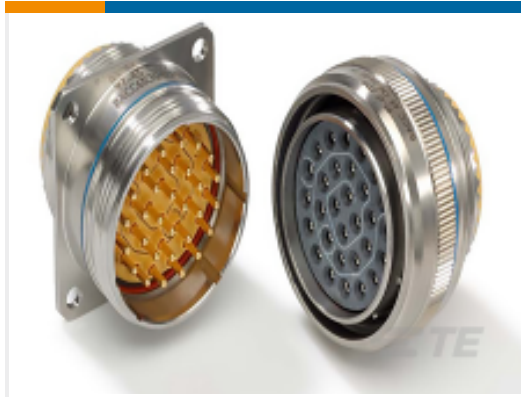
TE 产品编号ZPF0000000000036871 983-6SE 08-98 P6 L