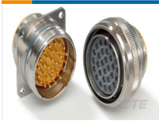
TE 产品编号ZPF000000000008045 983-3KE-C 18