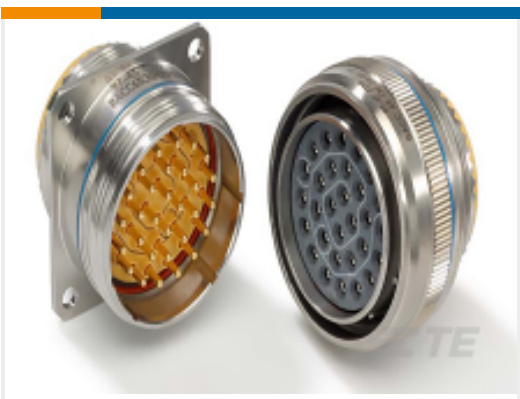
TE 产品编号ZPF000000000008044 983-3KE-C 16