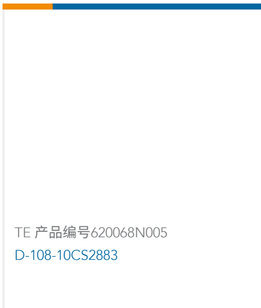
TE 产品编号620068N005 D-108-10CS2883