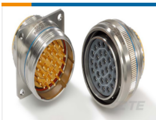
TE 产品编号 ZPF0000000000007148 983-0KE-PR 08