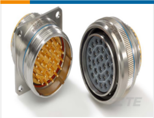
TE 产品编号ZPF000000000008046 983-3KE-C 20