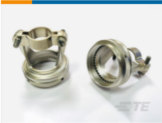
TE 产品编号2-2275010-1 ASSY,EN3660-004, AL-NI BACKSHELL, SZ08