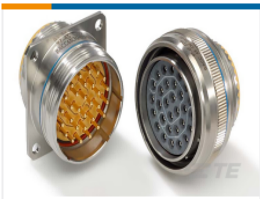
TE 产品编号ZPF000000000008042 983-3KE-C 12