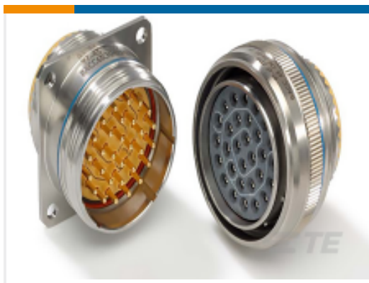
TE 产品编号ZPF000000000008041 983-3KE-C 10