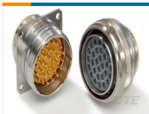
TE 产品编号 ZPF0000000000007464 983-0SE 08-03 PN