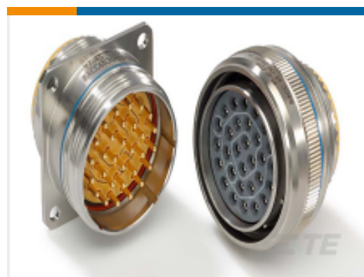
TE 产品编号 ZPF000000000008202 983-6KE 10-05 SN