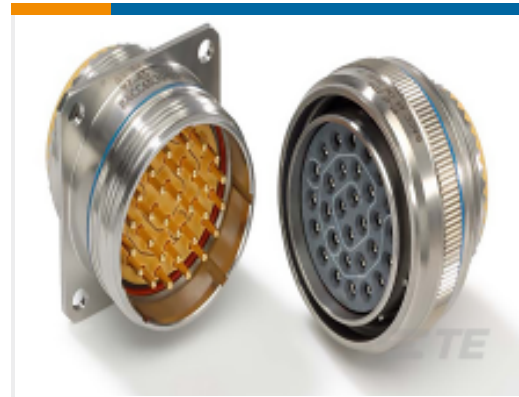
TE 产品编号ZPF000000000008026 983-1YE 08-03 P8