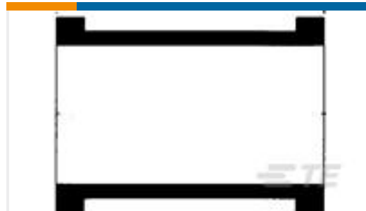
TE 产品编号395415-000 202W331-25-0