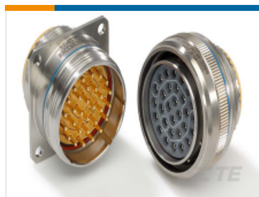
TE 产品编号 ZPF000000000008192 983-6KE 08-03 SN