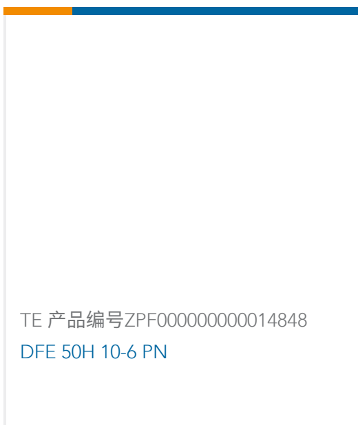
TE 产品编号ZPF00000000014848 DFE 50H 10-6 PN