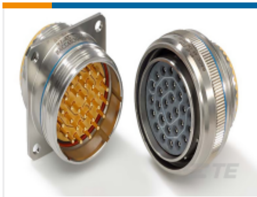
TE 产品编号ZPF000000000008027 983-1YE 08-03 P9