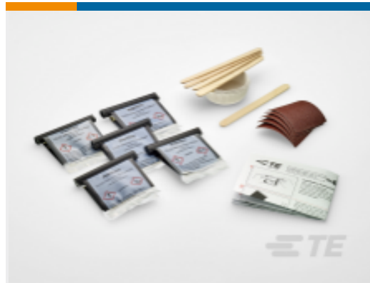
TE 产品编号878462-000 S1125-KIT-1