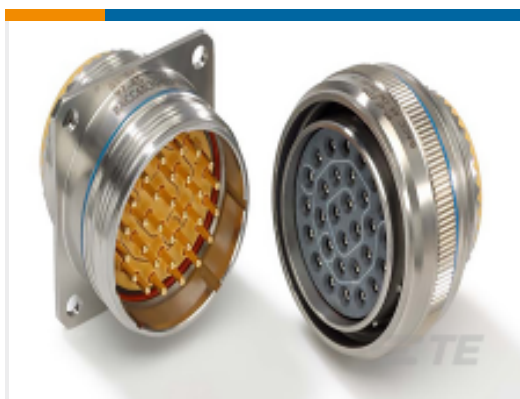
TE 产品编号ZPF00000000007999 983-1Y 08-03 PN