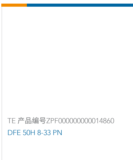
TE 产品编号ZPF00000000014860 DFE 50H 8-33 PN