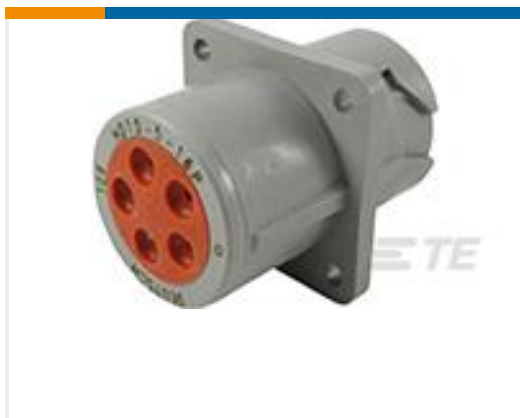
TE 产品编号HD10-5-16P SQ FG REC ASM