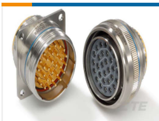
TE 产品编号ZPF00000000008037 983-1YE 12-12 PN