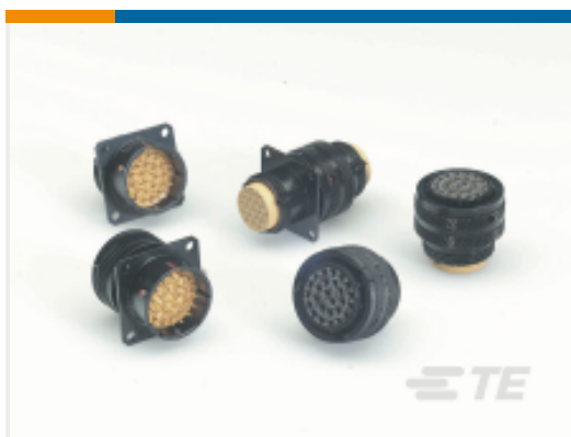
TE 产品编号ZPF00000000018816 FD8A 53H 8-3A-PX-K