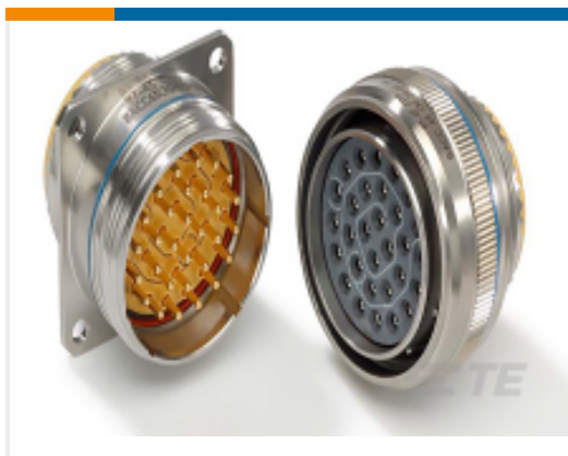
TE 产品编号ZPF00000000007992 983-1Y 08-03 P6