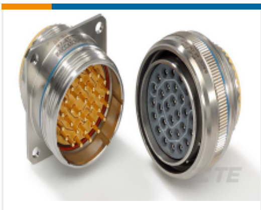
TE 产品编号ZPF00000000008007 983-1Y 10-05 P6