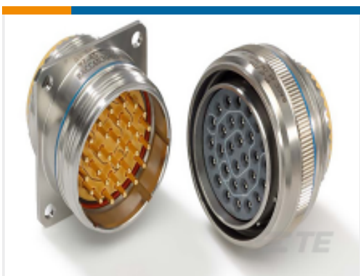
TE 产品编号ZPF00000000008102 983-6K 14-04 PN