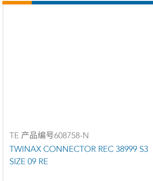
TE 产品编号608758-N TWINAX CONNECTOR REC 38999 S3 SIZE 09 RE