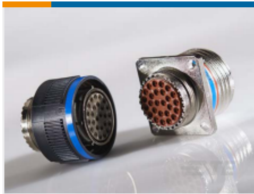
TE 产品编号ZPF000000000016119 DTS 20 K 15-19 PN