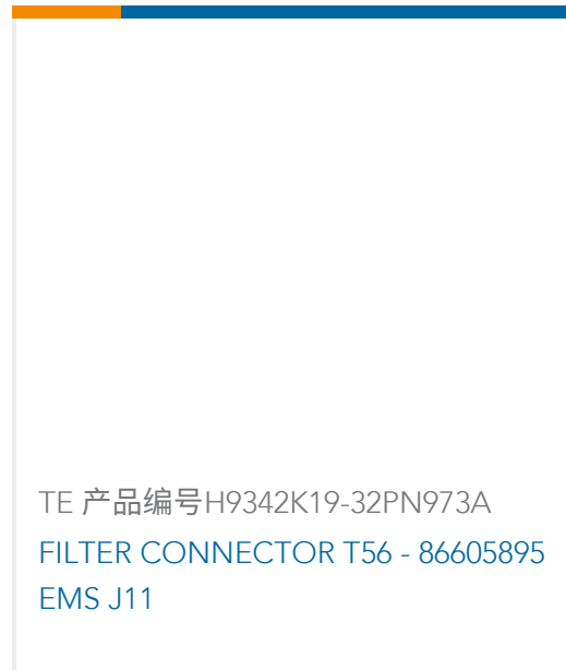
TE 产品编号H9342K19-32PN973A FILTER CONNECTOR T56 - 86605895 EMS J11