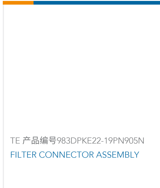
TE 产品编号983DPKE22-19PN905N FILTER CONNECTOR ASSEMBLY