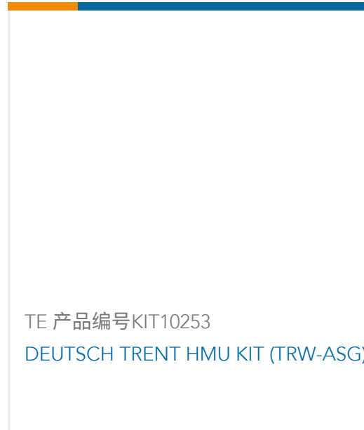
TE 产品编号KIT10253 DEUTSCH TRENT HMU KIT (TRW-ASG)