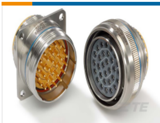
TE 产品编号 ZPF000000000035140 983-6KE 12-12 S6