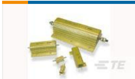
TE 产品编号5-1630186-8 HSA50 27R 1%