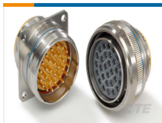
TE 产品编号 ZPF000000000008213 983-6KE 10-06 SN