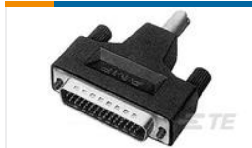
TE 产品编号1658680-1 KIT,HDP-22,ENCLSUR,PLUG,SIZE 3