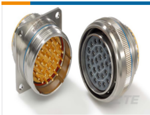
TE 产品编号ZPF000000000034478 983-0YE 18-14 PN