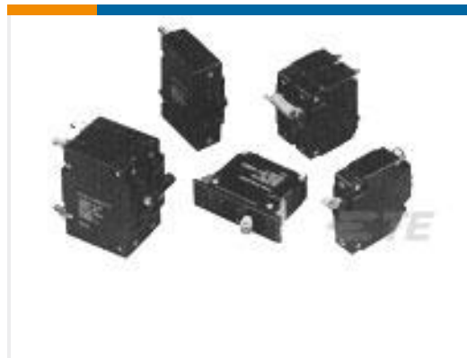
TE 产品编号6-1393252-6 W67-X2Q13-10=M6/M7/M9/W6/W7