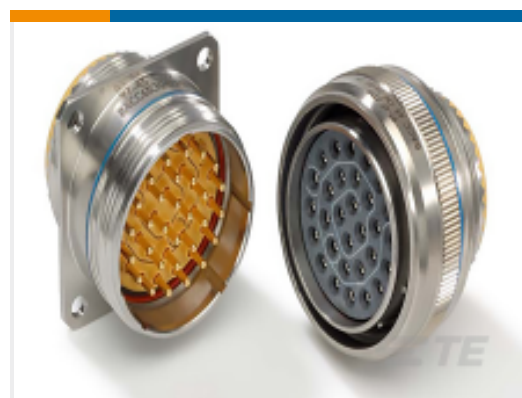
TE 产品编号 ZPF000000000008063 983-6K 08-03 S7