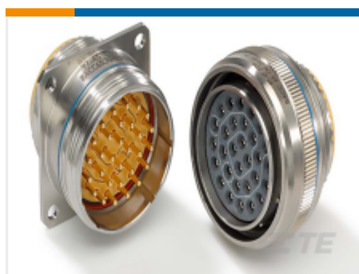
TE 产品编号ZPF000000000007726 983-0SE 24-61 PN