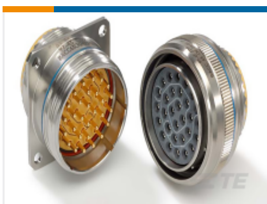
TE 产品编号ZPF000000000007685 983-0SE 20-41 PN