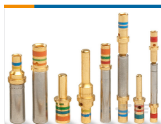
TE 产品编号 ZPF000000000001203 097-0016-20