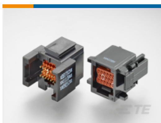
TE 产品编号ABC06N-20P IN-LINE PLUG