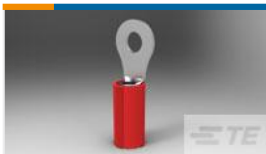
TE 产品编号51863-3 TERM,RING, PIDG, IR, 20, #6