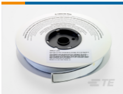
TE 产品编号195133-000 S1255-04-3/4X100FT