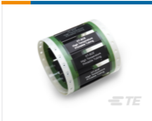
TE 产品编号4117110001 HT-SCE High Temperature Sleeves