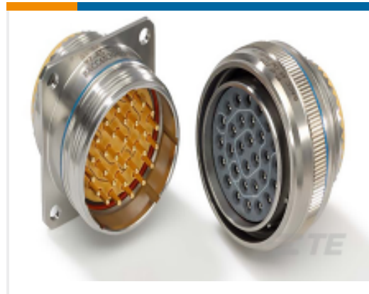
TE 产品编号ZPF100000000008204 983-6KE 10-05 SN-L