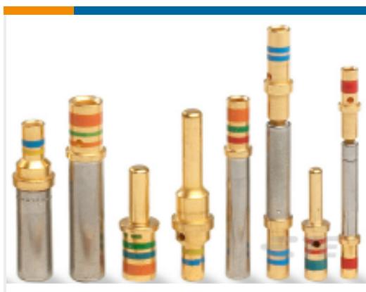
TE 产品编号0641-1-2031L CONT PIN