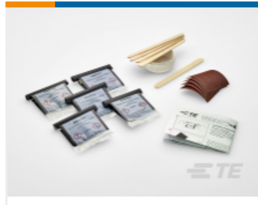
TE 产品编号878462-000 S1125-KIT-1