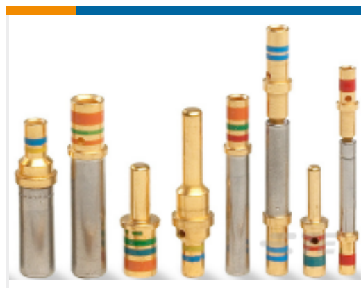
TE 产品编号109028-31 CONT PIN