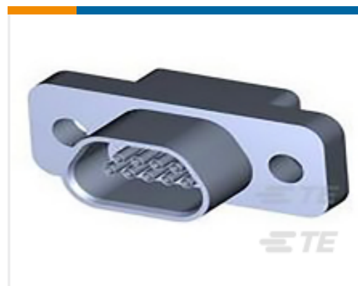
TE 产品编号2-1532171-0 M83513/04-A04C, MCKS-C2-B-9S6G9-36.0