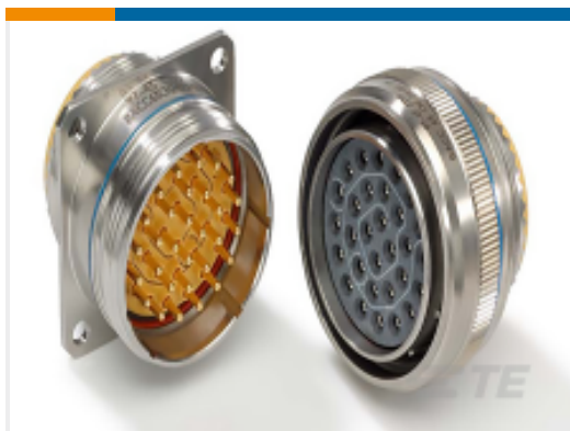
TE 产品编号ZPF000000000033692 983-0SE 16-10 S7 L