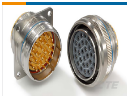
TE 产品编号ZPF00000000007629 983-0SE 18-14 S6 L