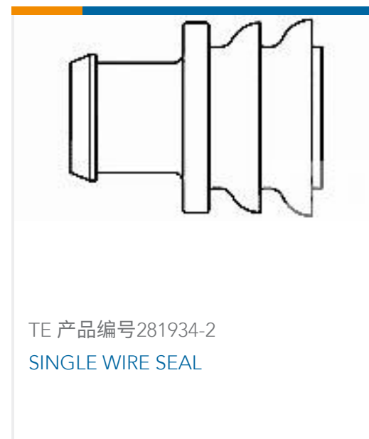
TE 产品编号281934-2 SINGLE WIRE SEAL