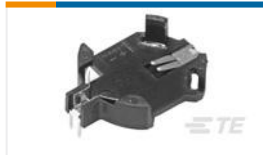
TE 产品编号796136-1 ASSY, SMT BATTERY CONN