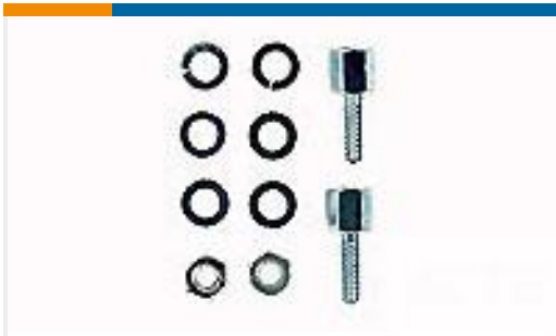
TE 产品编号5205817-3 FEMALE SCREWLOCK KIT