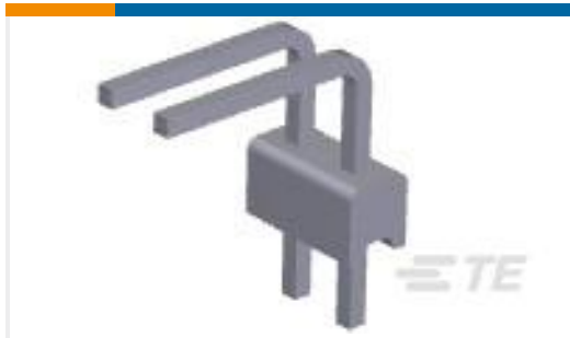
TE 产品编号3-644457-2 02P MTA100 HDR ASSY R/A NARROW