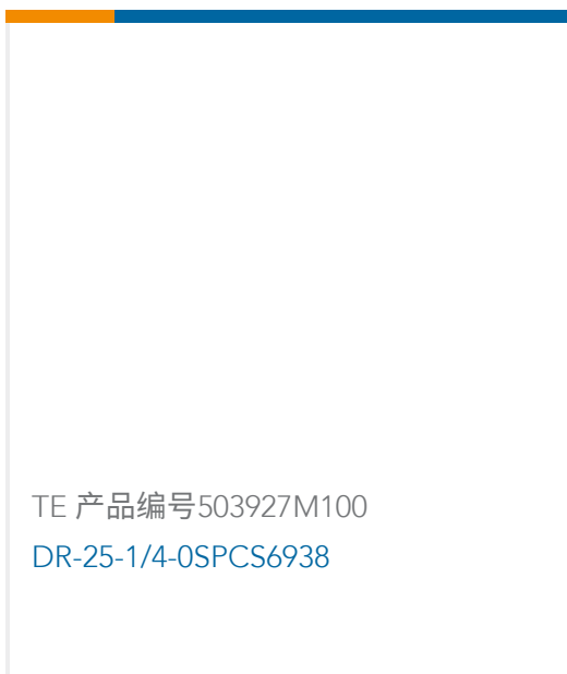
TE 产品编号503927M100 DR-25-1/4-0SPCS6938